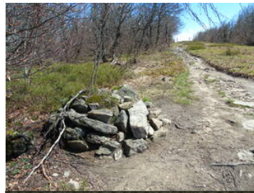
Pokaž opis pliku