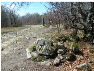
Pokaž opis pliku