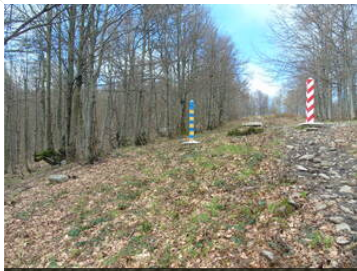
Pokaž opis pliku