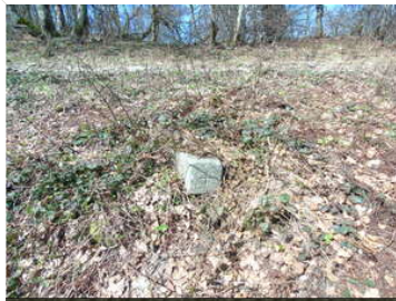
Pokaž opis pliku