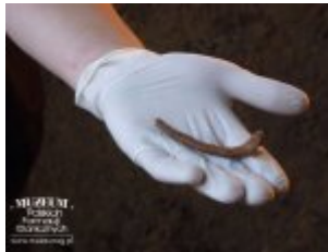
Pokaż opis pliku