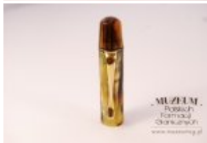
Pokaż opis pliku