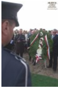
Pokaż opis pliku