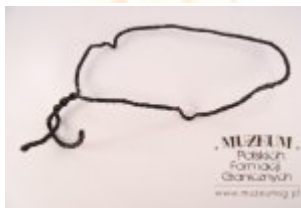
Pokaż opis pliku