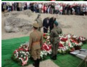
Pokaż opis pliku