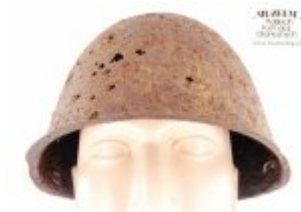
Pokaż opis pliku