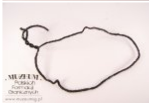
Pokaż opis pliku