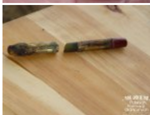
Pokaż opis pliku