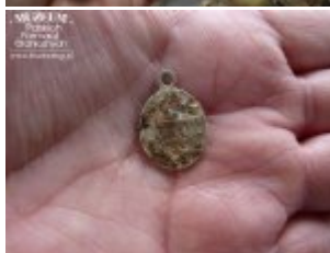
Pokaż opis pliku