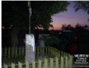
Pokaż opis pliku