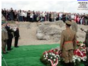
Pokaż opis pliku