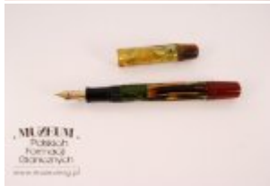
Pokaż opis pliku