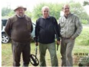
Pokaż opis pliku