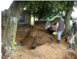
Pokaż opis pliku