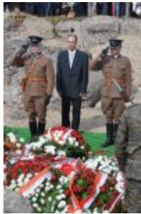
Pokaż opis pliku