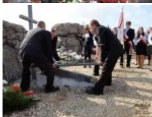
Pokaż opis pliku