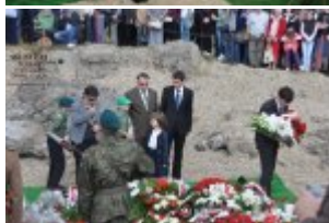
Pokaż opis pliku