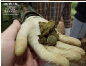
Pokaż opis pliku