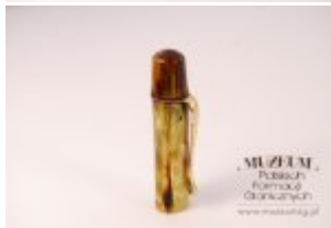
Pokaż opis pliku