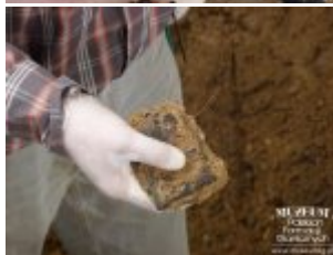
Pokaż opis pliku