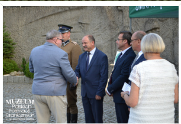
MUZEUM Polskich Formacji Granicznych ul. Wolności 100A