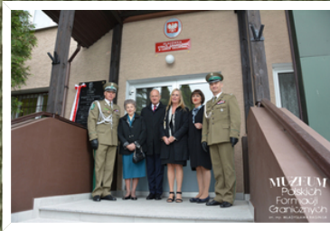
MUZEUJ Polskich Formacji Granicznych