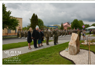
MUZEUJ Polskich Formacji Granicznych