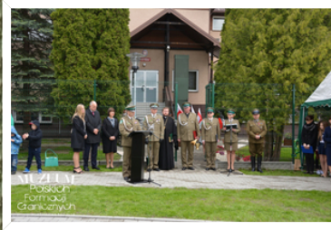
MUZEUJ Polskich Formacji Granicznych