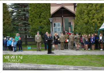
MUZEUJ Polskich Formacji Granicznych