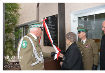
MUZEUJ Polskich Formacji Granicznych