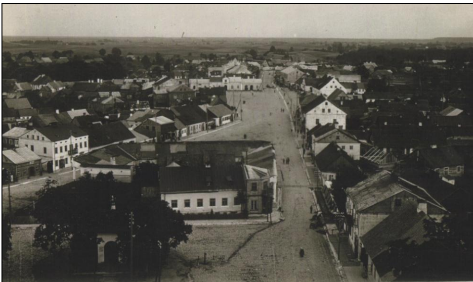
Sejny – widok z wieży katedry ok. 1924 r. (ze zbiorów J. Domosławskiego).

skupstwa wigierskiego (przemianowanego na Augustowskie czyli Sejneńskie), które przetrwało aż do 1925 roku.