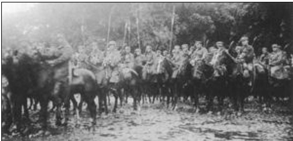
Kawaleria powstańcza.