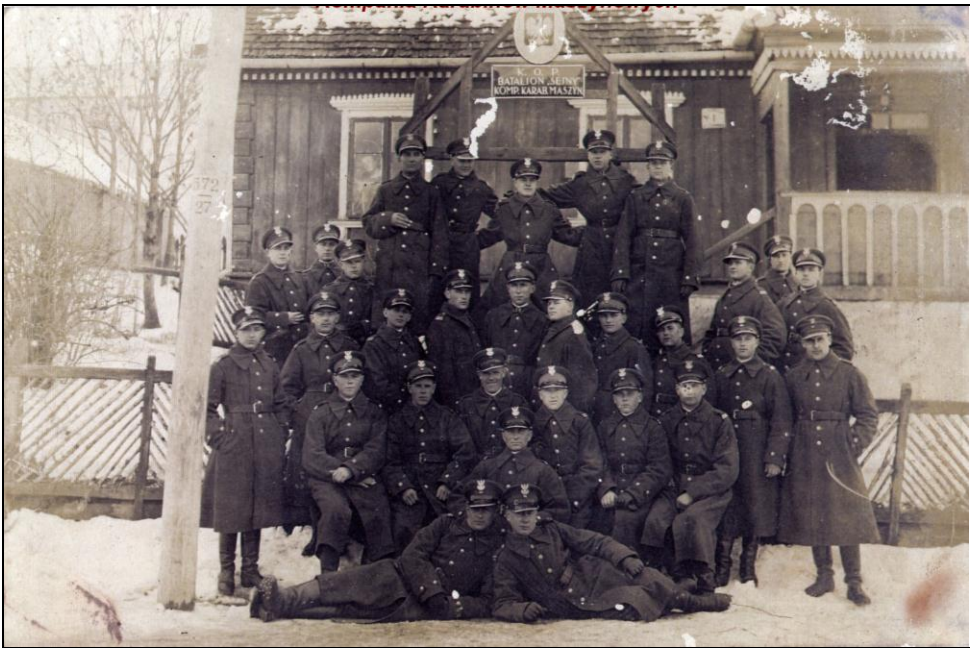
Kompania karabinów maszynowych 24 Baonu KOP „Sejny”.

Podczas podróży historycznej warto podać słuchaczom cały tekst, by nauczyć tej znanej i lubianej żołnierskiej piosenki. Wszak pieśni to także ważny element dziedzictwa tradycji i kształtowania etosu formacji.