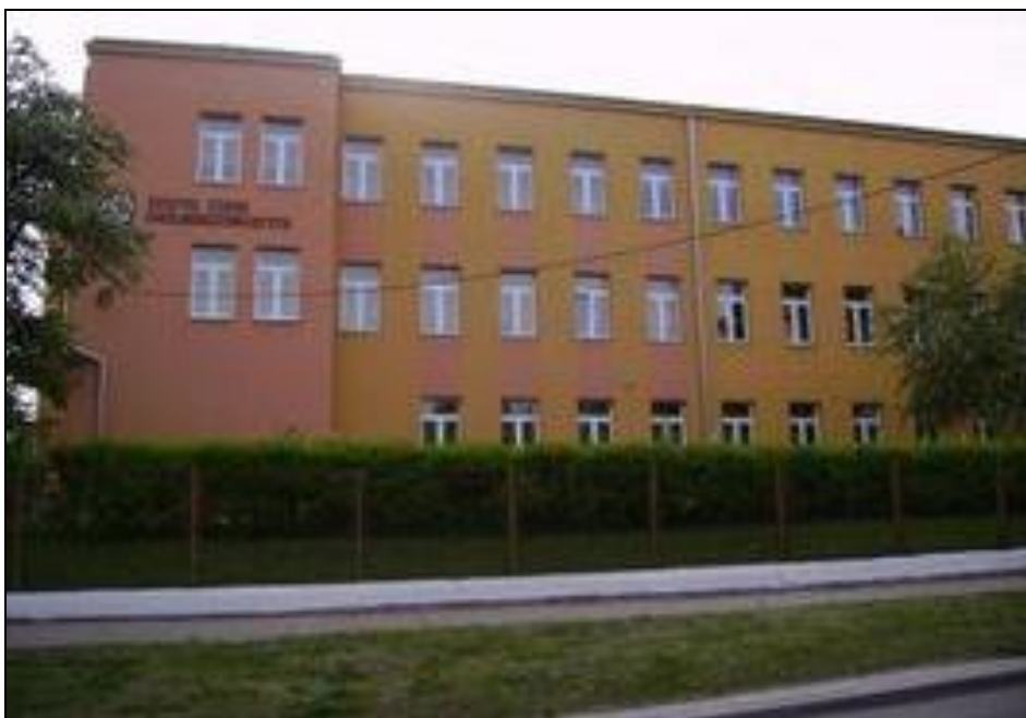
Dawne koszary 24 Batalionu KOP „Sejny” współcześnie. Dziś mieści się w nich Liceum Ogólnokształcące im. Szymona Konarskiego.