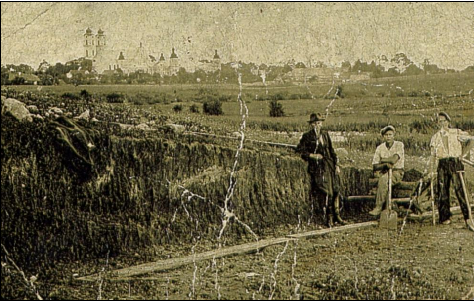
Budowa koszar dla Batalionu KOP „Sejny”.

Żołnierze KOP nie tylko wykonywali zadania wojskowe, ale także pomagali miastu w życiu ekonomicznym i kulturalnym. Wybudowali wiele odcinków lokalnych dróg, mostów, a także obiektów publicznych: Dom Ludowy, stadion sportowy, strzelnicę, remizę strażacką. Wraz z orkiestrą prowadzili każdą defiladę organizowaną w czasie uroczystości patriotycznych i świąt narodowych (3 maja, 15 sierpnia i 11 Listopada). Orkiestra batalionowa uświetniała niemal wszystkie festyny, zabawy taneczne i Biegi Narodowe. Ich pieśni wojskowe znał każdy mieszkaniec miasta.