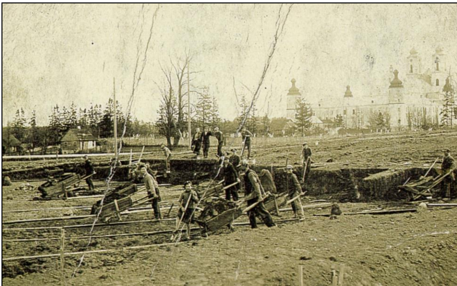
Budowa koszar dla Batalionu KOP „Sejny”.