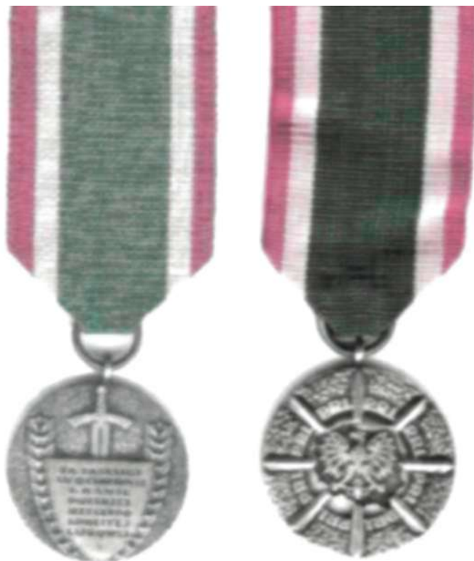
Zdjęcie 2. Odznaka „Za zasługi w Ochronie Granic PRL” – rewers i awers.

Grobelski Wojciech; O odznace „Za zasługi w ochronie granicy PRL”, Biuletyn Centralnego Ośrodka Szkolenia nr 1/03, Koszalin 2 0 0 3 , s. 81 – 8 4 .