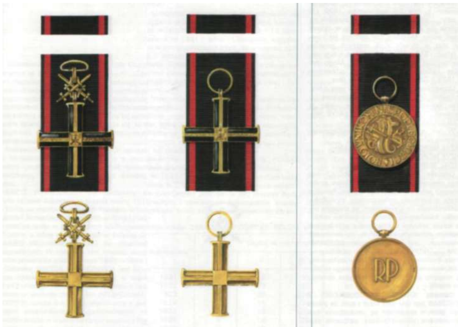
Reprodukcja zdjęcia Krzyża i Medalu Niepodległości. Od lewej: Krzyż Niepodległości z Mieczami, Krzyż Niepodległości, Medal Niepodległości.