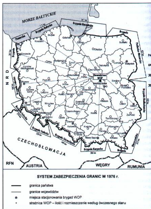
Mapa nr 2 System zabezpieczenia granic Polski w 1976 roku