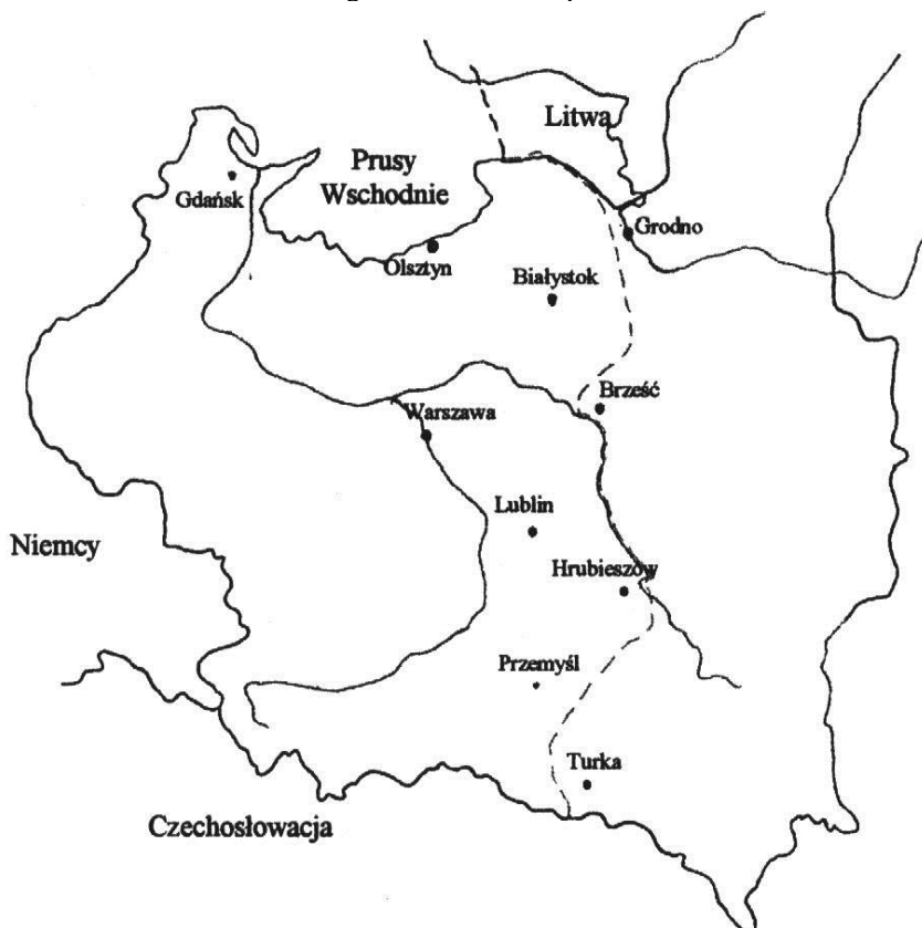
Przebieg linii Curzona z lipca 1920 r.