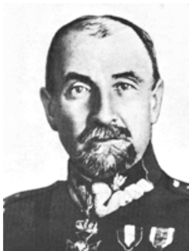
Szef Sztabu Generalnego WP gen. Tadeusz Rozwadowski (źródło: Ilustrowany atlas historii Polski, Warszawa 2006, s. 237).

W dniu 30 października 1918 roku Ministerstwo Apropowizacji zwróciło się pisemnie do szefa Sztabu Generalnego WP gen. Rozwadowskiego, z prośbą o oddelegowanie do nowej formacji oficerów oraz przynajmniej stuosobowej grupy podoficerów i szeregowych.