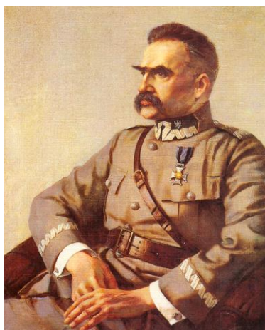
Naczelnik Państwa Józef Piłsudski (źródło: ze zbiorów Muzeum Wojska Polskiego w Warszawie, malarz: Stefan Garwatowski).

Sytuacja gospodarczo – polityczna w jakiej znalazła się Polska w listopadzie i grudniu 1918 roku, zmusiła rząd Jędrzeja Moraczewskiego do podjęcia prac nad stworzeniem nowej koncepcji ochrony granic. W czasie prowadzonych debat najwięcej kontrowersji wzbudziły decyzje dotyczące charakteru i wielkości mającej powstać formacji granicznej. Koła wojskowe skupione wokół Józefa Piłsudskiego forsowały projekt, który zakładał, że na nieustabilizowanych jeszcze granicach powinna stać formacja zorganizowana na sposób wojskowy, prężna, dobrze uzbrojona, wyszkolona i zdyscyplinowana, zdolna do zabezpieczenia granic, nie tylko pod względem ekonomicznym, ale także wojskowo – politycznym 8 .