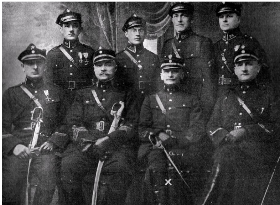
Oficerowie pierwszych formacji granicznych Polski niepodległej (źródło: Stój! Straż Graniczna! , Warszawa 1938, s. 13).