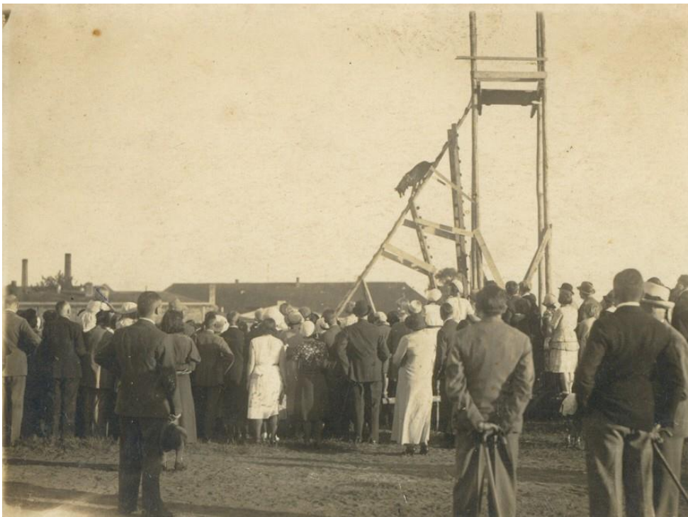
Pokaz szkolenia psów służbowych w Straży Granicznej.

Stan osobowy Szkoły ulegał zmianie w zależności od ilości szkolonych. Przykładowo 25 września 1929 roku przedstawiał się następująco: