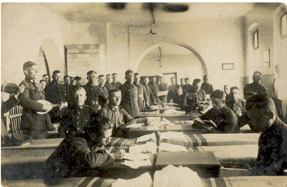
Słuchacze Centralnej Szkoły Straży Granicznej w izbie mieszkalnej.

W Centralnej Szkole Straży Granicznej organizowano kursy doszkolenia szeregowych Straży Granicznej. Trwały one 5 miesięcy a słuchacze przenoszeni byli na ten okres do stanu osobowego szkoły.