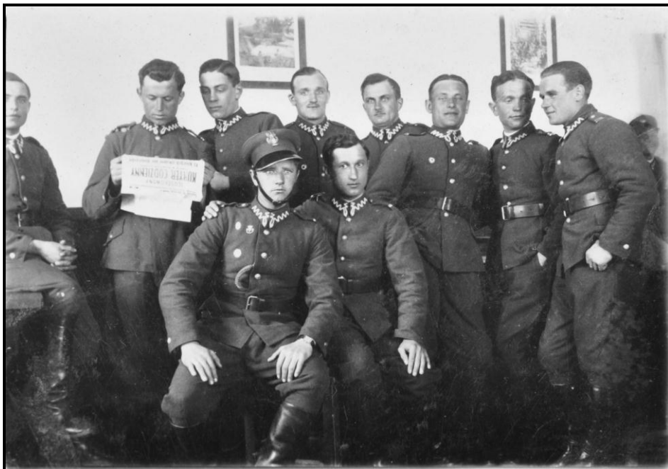
Żołnierze KOP na terenie Szkoły Podoficerskiej w Czortkowie. Kompania PW i WF w Buchaczu–1936 rok 15 .

Począwszy od 1938 r. wprowadzono w KOP kursy informacyjno – graniczne dla wszystkich oficerów przeniesionych z armii. Celem kursu było zorientowanie oficerów w zakresie szczegółowych problemów charakterystycznych dla Korpusu jako formacji wojskowej, powołanej do wykonywania zadań specjalnych oraz jako formacji ochrony granic.