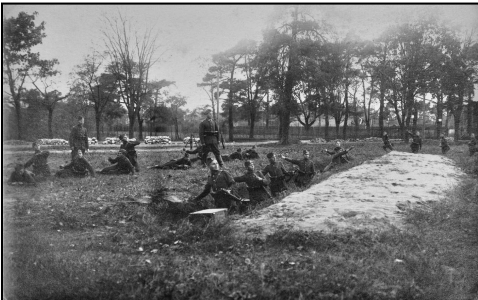
Ćwiczenie 3 drużyny 1 kompanii szkolnej na rzutni granatem na terenie Centralnej Szkoły Podoficerskiej Korpusu Ochrony Pogranicza w Osowcu dnia 20 lutego 1938 r. 10 .

Skala ocen była następująca: dobry (5pkt), średni (3pkt), zły (1pkt) 11 .