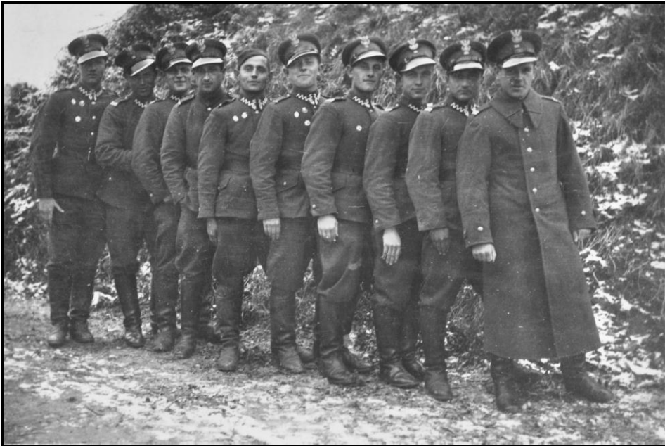
Żołnierze KOP na terenie Szkoły Podoficerskiej w Czortkowie. Kompania PW i WF w Buchaczu–1936 rok 16 .

W 1931 r. w Dowództwie Korpusu Ochrony Pogranicza został utworzony Urząd WF i PW z Kierownikiem Urzędu na czele, podległym bezpośrednio Dowódcy KOP.