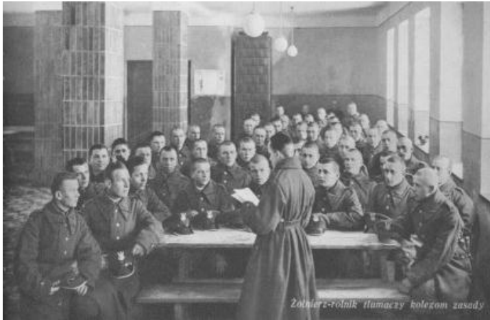
Żołnierz – rolnik tłumaczy kolegom zasady uprawy roli 12

W ŻSP nauczano następujących przedmiotów: języka polskiego, matematyki, historii, geografii, a także elementów wiedzy ogólnowojskowej i granicznej oraz wiadomości z zakresu praw i obowiązków żołnierskich. Kierownikami kursów początkowego nauczania byli głównie oficerowie oświatowi, nauczycielami zaś wytypowani oficerowie, starsi podoficerowie oraz nauczyciele szkół cywilnych. Należy podkreślić nie tylko poświęcenie ludzi zaangażowanych w akcję nauczania, ale także duży jej rozmach. Nauką objęto wszystkich analfabetów i półanalfabetów, którzy trafili do KOP. Rocznie przeszkalano od 15 do 20 tysięcy szeregowców na kursach wszystkich trzech stopni 13 .