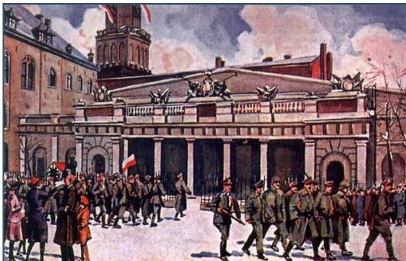
Powstańcy wielkopolscy przed odwachem w Poznaniu.

Gen. Dowbor – Muśnicki dysponował armią liczącą 70 tysięcy żołnierzy. Po zaciętych walkach Niemcy wyparci zostali poza granice Wielkiego Księstwa Poznańskiego 2 . Rozejm z Niemcami z 11 listopada 1918 roku został rozciągnięty również na linię przerwania walki w Wielkopolsce, zaś wyniki powstania usankcjonował traktat pokojowy. Gdy w Wielkopolsce toczyły się walki, zbliżał się dzień inauguracji konferencji pokojowej w Paryżu. Czekano w napięciu na jej wyniki, ona bowiem miała decydować o kształcie terytorialnym wielu państw europejskich.