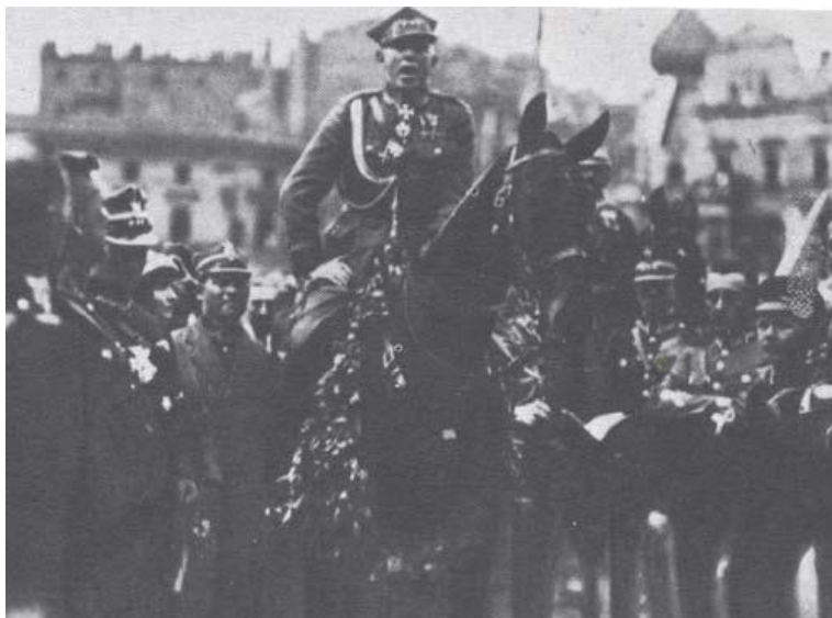
Gen. Szeptycki na czele Wojska Polskiego wkracza do Katowic – 22 czerwca 1922 r. (źródło: Ilustrowany atlas historii Polski, Warszawa 2006, s 230).

46% ludności), Niemcy zaś otrzymały Bytom, Gliwice, Racibórz i 76% kopalń węgla 6 .