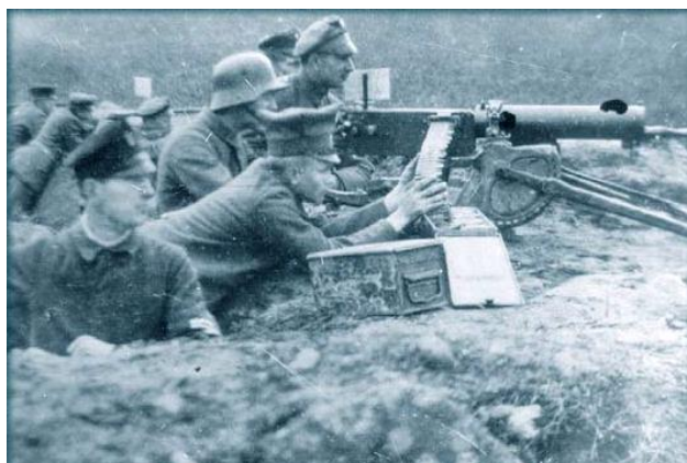
Powstańcy wielkopolscy na froncie (źródło: reprodukcja ze zbiorów B. Polaka).

Gen. Dowbor – Muśnicki dysponował armią liczącą 70 tysięcy żołnierzy. Po zaciętych walkach Niemcy wyparci zostali poza granice Wielkiego Księstwa Poznańskiego 2 . Rozejm z Niemcami z 11 listopada 1918 roku został rozciągnięty również na linię przerwania walki w Wielkopolsce, zaś wyniki powstania usankcjonował traktat pokojowy. Gdy w Wielkopolsce toczyły się walki, zbliżał się dzień inauguracji konferencji pokojowej w Paryżu. Czekano w napięciu na jej wyniki, ona bowiem miała decydować o kształcie terytorialnym wielu państw europejskich.