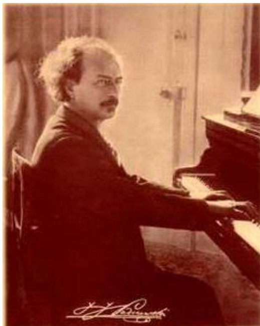
Ignacy Jan Paderewski.

Dzięki walkom u boku państw Ententy, delegacja polska mogła zasiadać na konferencji pokojowej jako „państwo sprzymierzone i zwycięskie”. Zaszczyc ten Polska dzieliła z delegacjami 26 innych państw, m. in. takich jak Ekwador czy Honduras. W dniu 18 stycznia 1919 roku w pałacu Ministerstwa Spraw Zagranicznych na Quai d'Orsay zebrała się po raz pierwszy „konferencja Międzynarodowa dla Preliminariów pokojowych”. Polskę reprezentowało dwóch delegatów: premier Ignacy Jan Paderewski i Roman Dmowski.