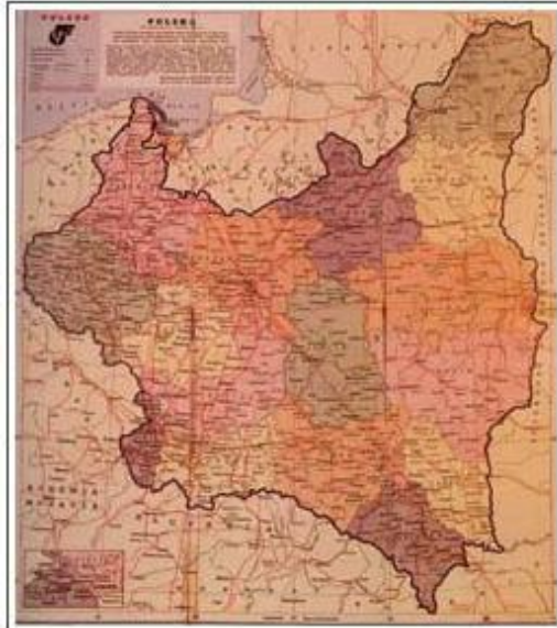
Granice Polski odrodzonej.

(po ZSRR, Niemczech, Francji, Hiszpanii i Szwecji) z ludnością liczącą ponad 27 milionów osób, co dawało jej również 6 miejsce 9 .