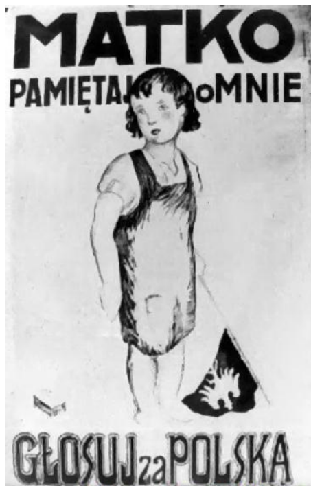
Polski plakat plebiscytowy na Śląsku.

Przed plebiscytem Niemcy rozwinęły wielką akcję propagandową, co doprowadziło do wybuchu w nocy z 16 na 17 sierpnia 1919 roku pierwszego powstania śląskiego. Zostało ono po 10 dniach stłumione przez Niemców i rozpoczęły się liczne represje.