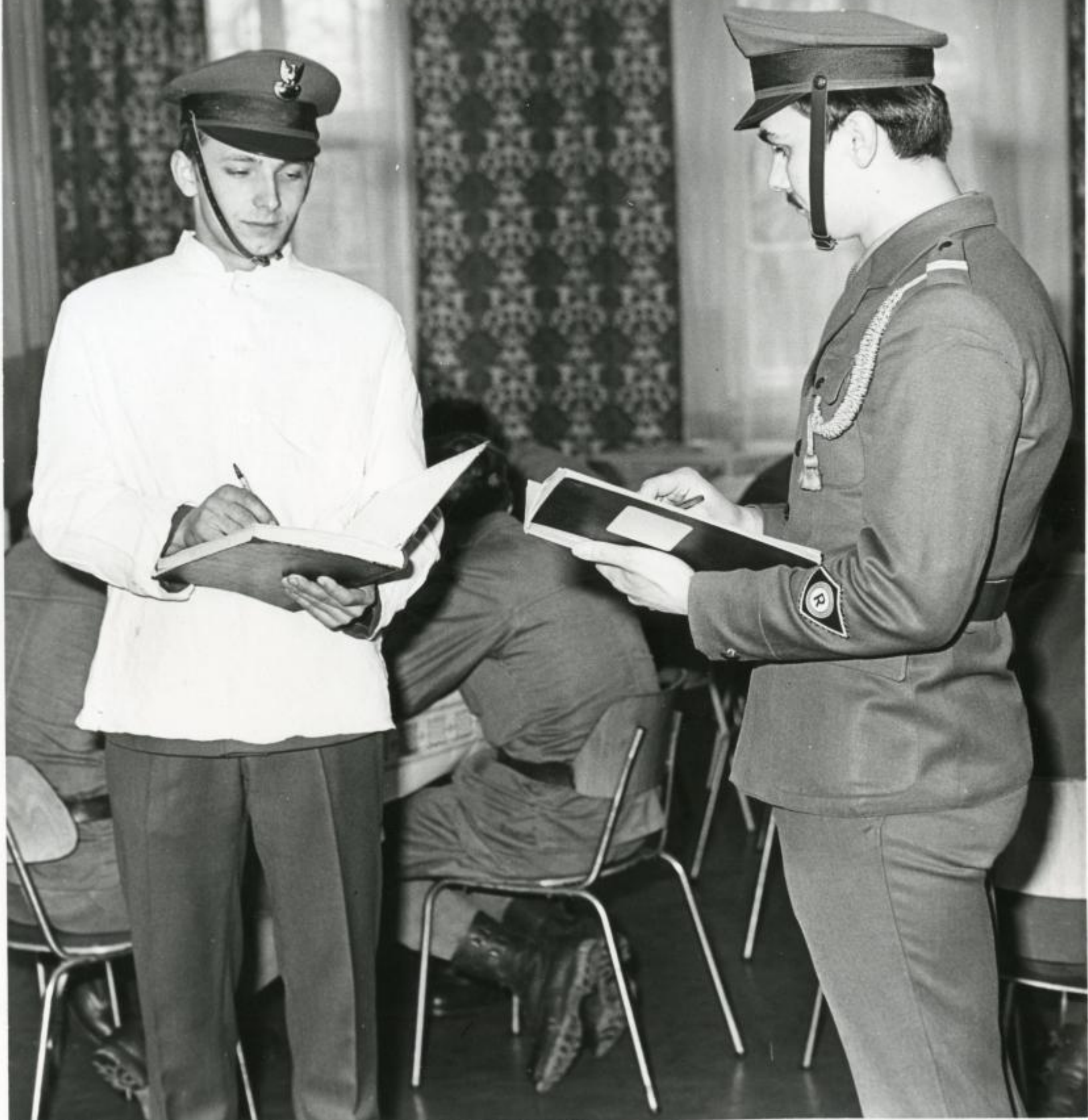
Podoficer dyżurny obowiązany jest podać, liczbę nieobecnych żołnierzy, celem pozostawienia im posiłków.