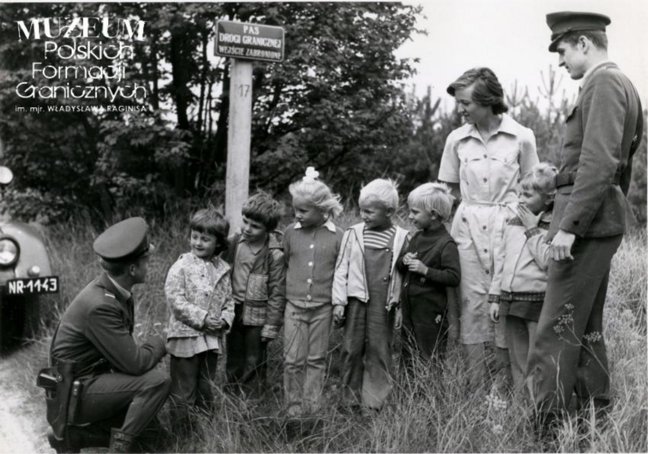
Pierwsze zetknięcie z granicą