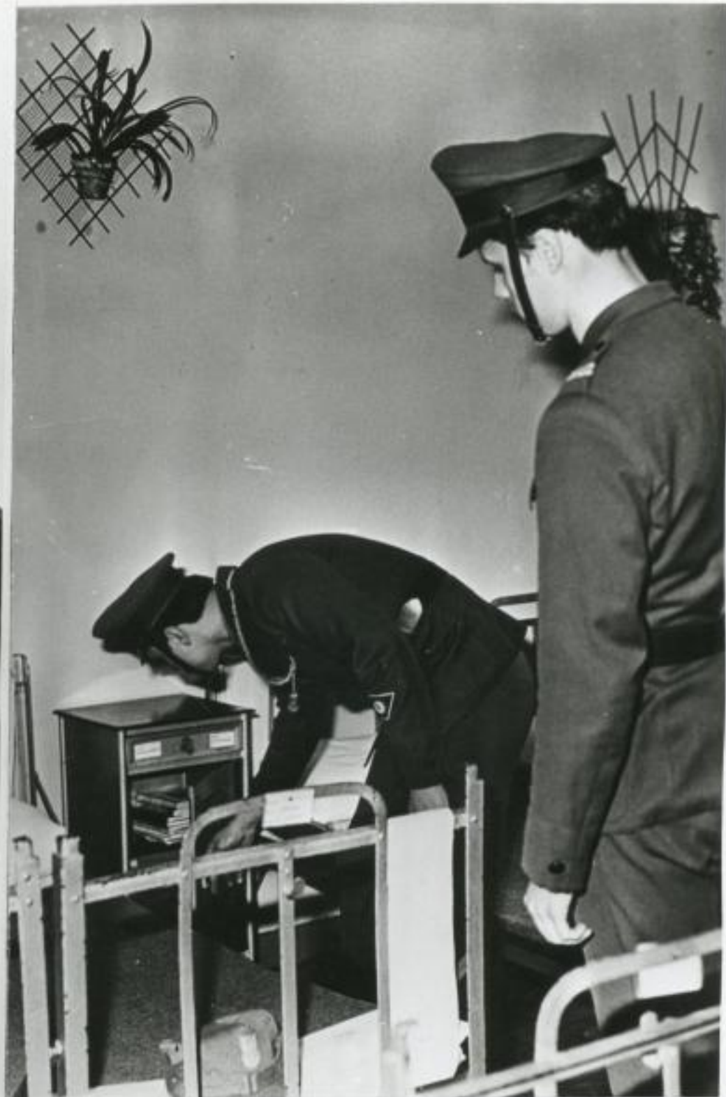
Podoficer dyżurny dba o porządek, sprzęt i mienie kompanii.