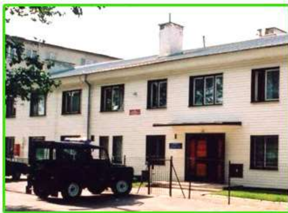
Strażnica w Krynkach.

Rok 1995 przynosi otwarcie nowej strażnicy na odcinku granicy polsko-białoruskiej w m. Krynki. Dwa lata wcześniej za sumę 1 mld 228 mln złotych Oddział zakupił działkę o powierzchni 1949 m 2 , od byłego PGR-u.