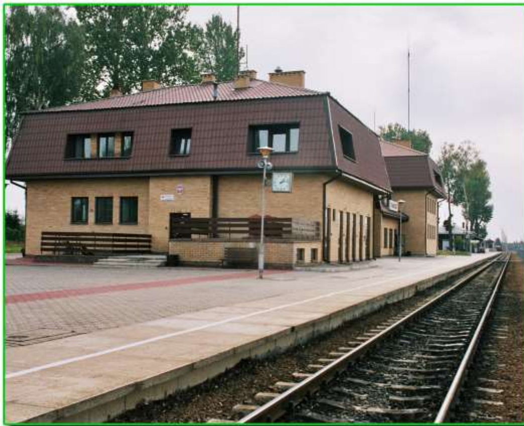
Przejście kolejowe Trakiszki.

Reprezentacja naszego Oddziału w lipcu 1992 roku wzięła udział w I Olimpiadzie Miejskiej organizowanej przez Prezydenta Miasta Białystok i zajęła II miejsce w rozgrywkach w piłkę nożną.