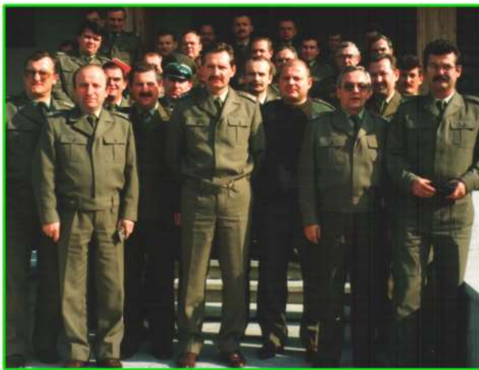
Kierownicza kadra Podlaskiego Oddziału Straży Granicznej.

W dniu 6 października br. Odbyła się wyjazdowa odprawa kierowniczej kadry Oddziału w Strażnicy Białowieża. Poruszane tematy dotyczyły trudności w ochronie granicy oraz stanu dyscypliny wśród kadry.