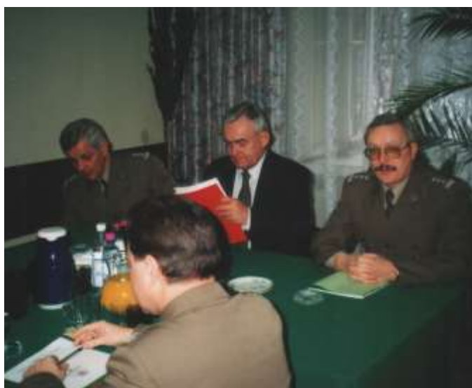
Odprawa służbowa z Ministrem MSW i Komendantem Głównym SG.

W trakcie wizyty Minister Leszek Miller zapowiedział, między innymi że w Nowym Roku 1997 zostaną powołane międzyresortowe grupy do walki z przestępczością zorganizowaną. W skład których wejdą funkcjonariusze Policji, Straży Granicznej, celnicy oraz przedstawiciele UOP, prokuratury i Izby Skarbowej.