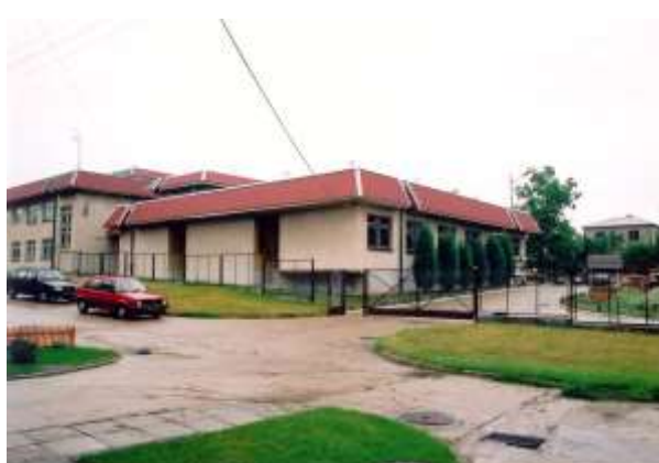
Strażnica SG w Puńsku.

W dniu 5 maja 2000 roku do systemu ochrony granicy państwowej włączona została Strażnica Straży Granicznej w Puńsku.