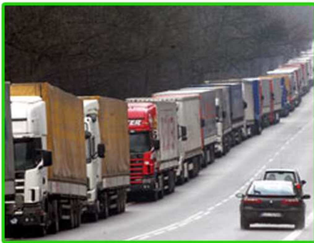
Kolejka tirów przed przejściem drogowym w Bobrownikach.

W nocy z 12 na 13 lutego kierowcy ciężarówek na trzy godziny zablokowali ruch na drogowo-towarowym przejściu granicznym Bobrowniki - Bierestownica.