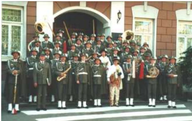
Na piątkę z plusem spisala się Orkiestra Reprezentacyjna Straży Granicznej z Nowego Sącza.