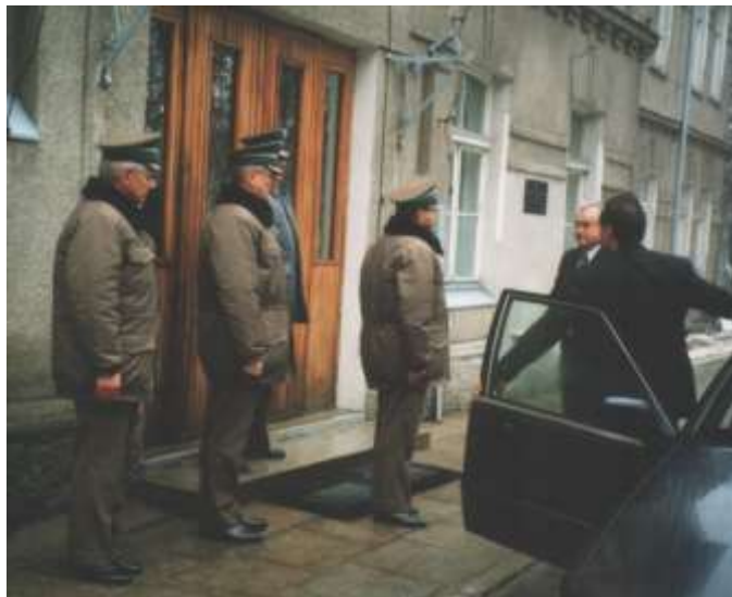
Meldunek dla Ministra składa Komendant Podlaskiego OSG.

Nasza wschodnia granica będzie niedługo zewnętrzną granicą Unii Europejskiej. W związku z tym musi być ona skutecznie chroniona. W dniu 16 stycznia 1997 roku Podlaski Oddział SG odwiedził Minister MSW Leszek Miller, któremu towarzyszył Komendant Główny Straży Granicznej Pan płk Andrzej Anklewicz.