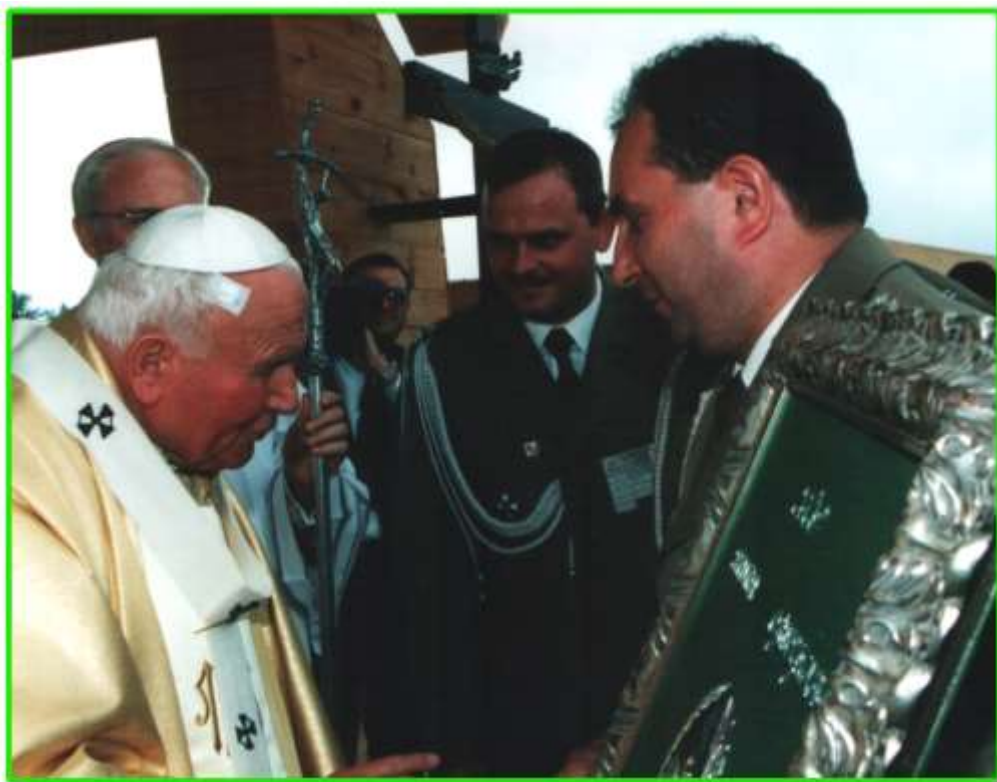
W Starym Sączu Komendant Główny SG podarował pamiątkę dla Ojca Świętego logo Straży Granicznej wykonanej w Białymstoku.

Na zaproszenie Komendy Głównej SG w dniu 24 czerwca 1999 roku przebywała w naszym Oddziale gościnnie delegacja Żandarmerii Tureckiej. Spotkali się oni z kierowniczą kadrą Oddziału. Zainteresowani byli głównie systemem ochrony granicy oraz zmianami jakie następują na granicy wschodniej Polski.