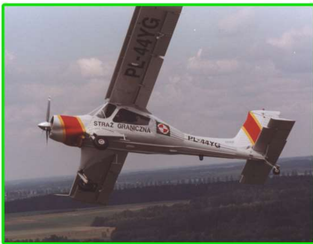
Wilga 2000 w locie patrolowym.

W dniu 16 lipca 1998 roku funkcjonariusze PoOSG wraz z Policją prowadzili działania prewencyjne, których celem było zapobieganie przestępczości granicznej. Zatrzymano cudzoziemców – obywateli Armenii i Azerbejdżanu, którzy nie posiadali wymaganego pozwolenia na pobyt w kraju. Łącznie w regionie naszym podczas dalszej akcji skontrolowano 781 pojazdów i 1080 osób. Podobne wspólne działania będą w przyszłości kontynuowane.