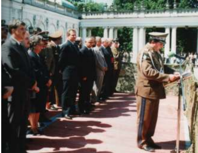
Przemawia Komendant Główny Straży Granicznej.