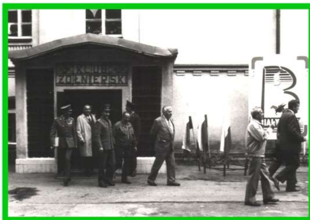
Ostatnie dni Klubu Żołnierskiego.