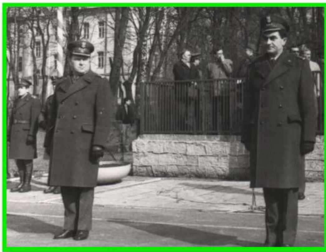
Uroczyste przekazanie obowiązków Dowódcy PMB WOP dla Komendanta PoOSG.

Natomiast z dniem 8 maja Komendant Podlaskiego Oddziału SG mianował na stanowiska Naczelników poszczególnych Wydziałów niżej wymienione osoby: