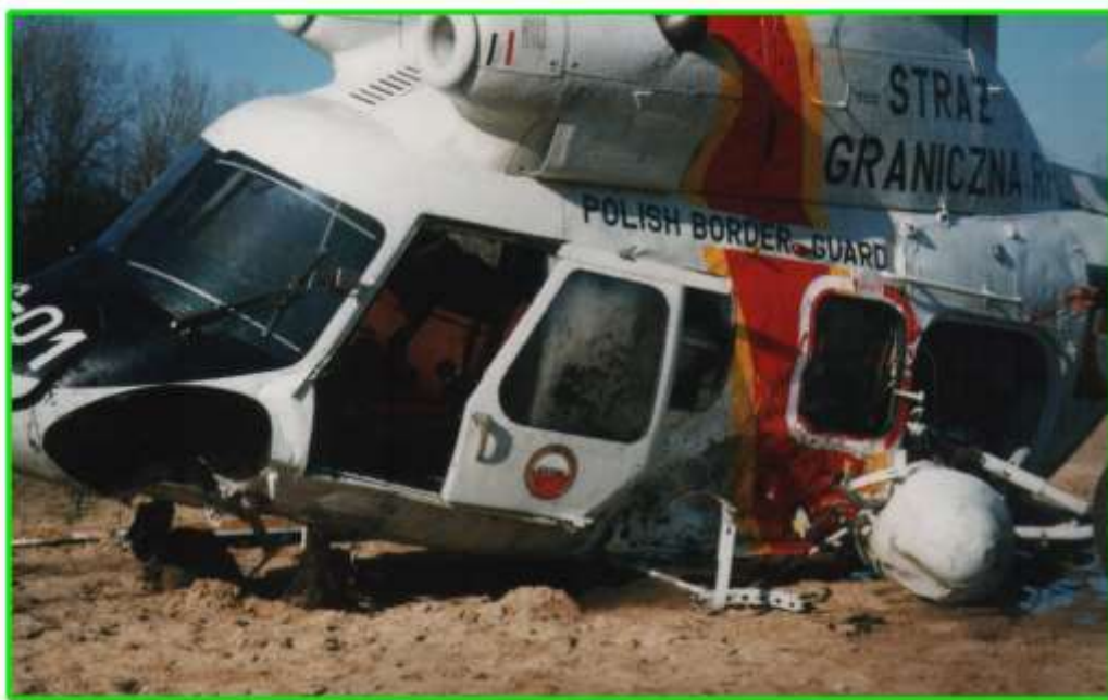
Wygląd kadłuba śmigłowca.

Komendant Główny SG powołał specjalną Komisję do ustalenia przyczyn wypadku.