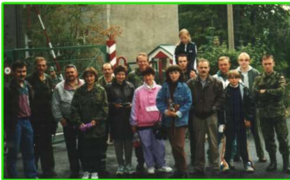
Działacze Harcerskiej Służby Granicznej.

W dniach 19 i 20 września w Szklarskiej Porębie odbyło się spotkanie działaczy, instruktorów oraz drużynowych funkcjonariuszy prowadzących drużyny Harcerskiej Służby Granicznej. Reaktywowane drużyny HSG z powrotem powróciły na stałe na teren pogranicza.