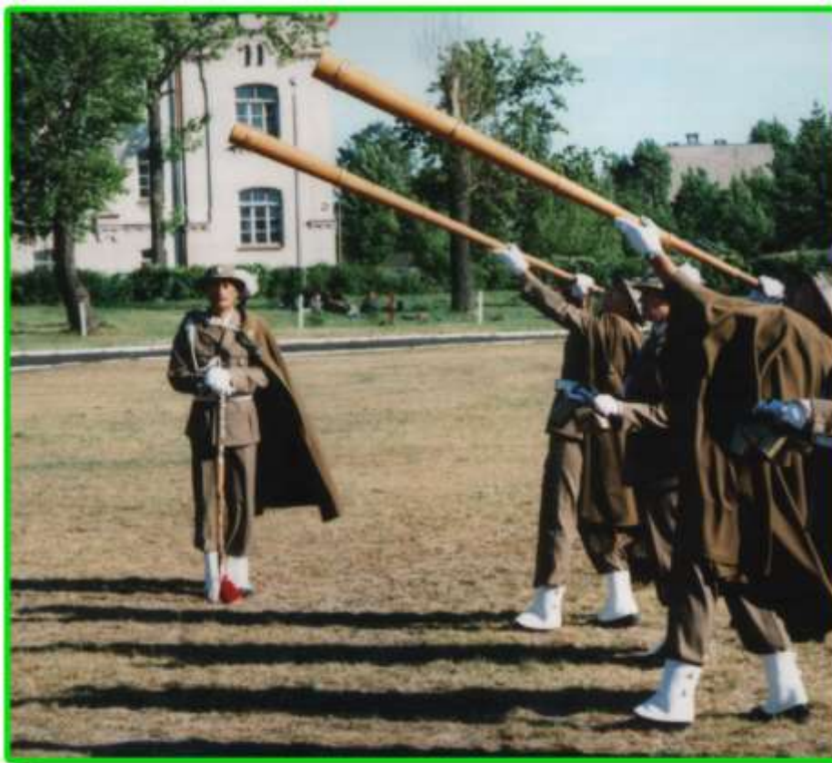
Trombity góralskie ogłosiły Święto Straży Granicznej w Białymstoku.

W IX rocznicę powołania Straży Granicznej Centralne Uroczystości obchodzone były w Białymstoku.