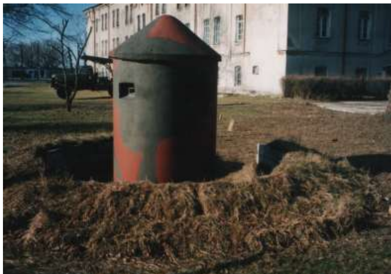
Budka betonowa wartownicza niemiecka z okresu II wojny światowej.

W dniu 2 grudnia 1996 roku została podpisana umowa pomiędzy Muzeum Wojska, a Podlaskim Oddziałem SG w celu utworzenia na terenie naszego Oddziału Muzeum Oddziałowego Wojska.