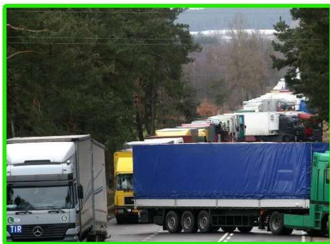
Blokada na drodze dojazdowej do Kuźnicy.

W dniu 27 grudnia 1997 roku weszła w życie nowa ustawa o cudzoziemcach, która zaostrzyła, a raczej urealniła zasady wjazdu do naszego kraju. Doszło do manifestacji kupców i właścicieli drobnych przedsiębiorstw przeciwko zahamowaniu ruchu granicznego. Ponad półtora tysiąca kupców demonstrowało w dniu 20 stycznia pod Urzędem Wojewódzkim w Białymstoku, a dwa tygodnie później doszło do blokady przejścia granicznego w Kuźnicy Białostockiej.