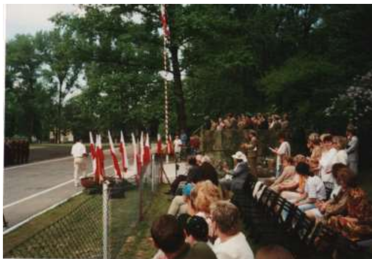
Wśród gości było wiele rodzin.