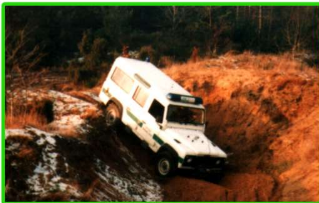
Samochód osobowo – terenowy Land Rover w terenie.

Nasz Oddział wzbogacił się o 29 pojazdów osobowo-terenowych typu Land Rover oraz jeden samochód specjalistyczny – więźniarkę.