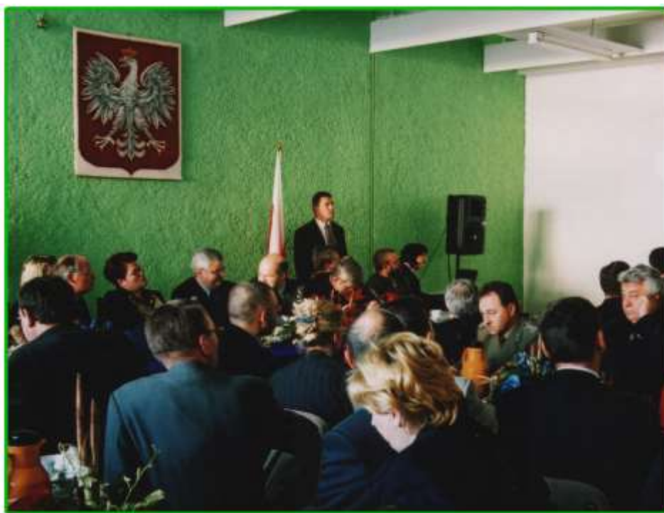
Wizyta G. Verheugena na Podlasiu w dniu 22 października 2000 r.

Wizyta minęła w miłej atmosferze, komisarz wyraził pogląd, że Polska będzie silnym i równoprawnym członkiem Unii Europejskiej.