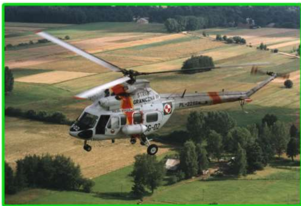
Patrowanie granicy przez śmigłowiec SG.