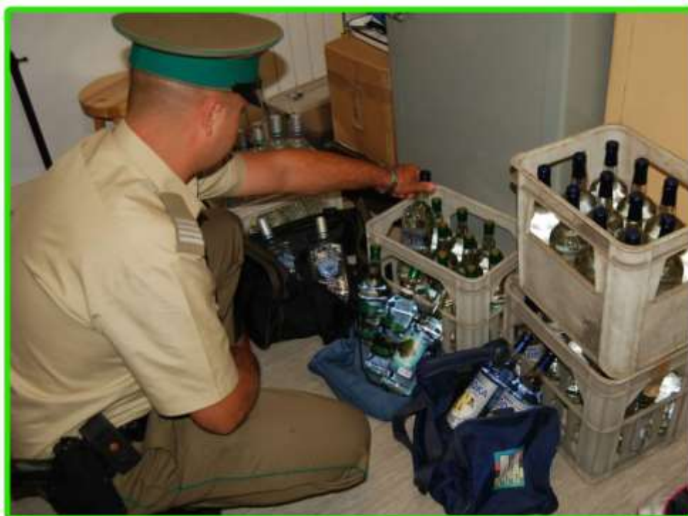
Ujawniony alkohol na przejściu granicznym.

Ponadto ujawniliśmy 34 przypadki fałszerstw dokumentów. Zwykle w skradzionych paszportach zmieniano fotografie. Przez przejście w regionie w ubiegłym roku tj. 1994 przejechało ok. 6,7 mln. osób.