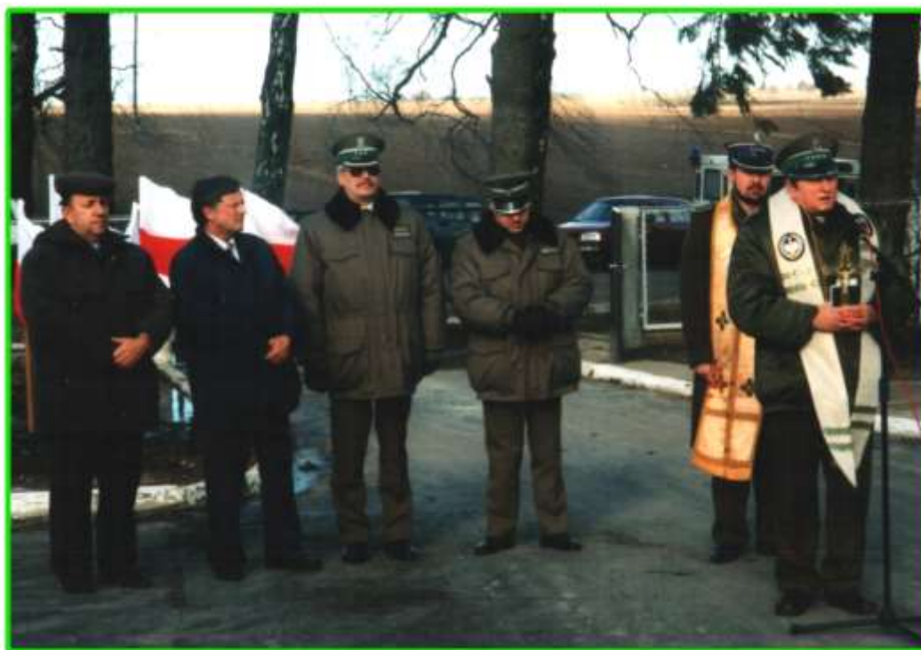
Poświęcenia dokonują kapelani wyznania rzymskokatolickiego i prawosławnego.

Strażnica umiejscowiona między strażnicami w m. Lipsku i Sokółce, pozwoli na skuteczniejszą kontrolę graniczną.