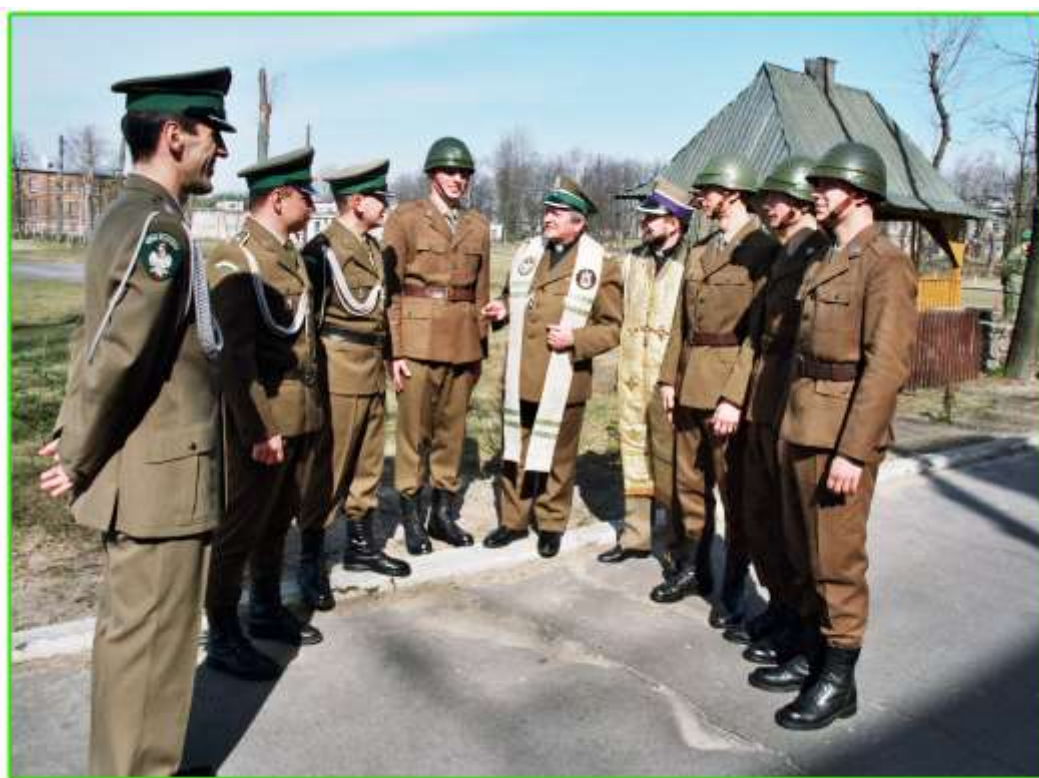
Spotkanie duszpasterskie przed ślubowaniem.

Po okresie szkolenia podstawowego zostaną skierowani do strażnic i placówek GPK na granicy z Litwą i Białorusią.