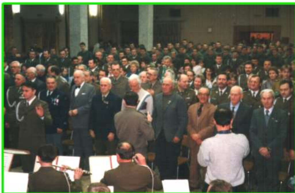
Żołnierze Korpusu Ochrony Pogranicza.