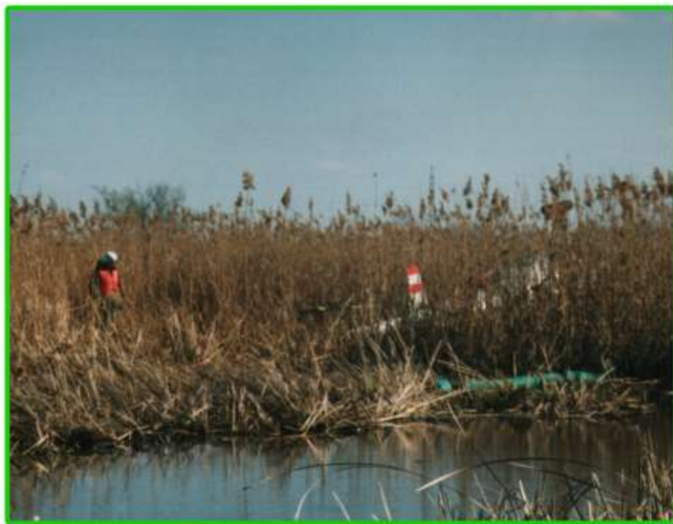
Bagna zamortyzowały upadek śmigłowca.

Był to pierwszy wypadek tego typu. Z całej siedmioosobowej załogi, urazu kręgosłupa doznało tylko trzech funkcjonariuszy. Maszyna została bardzo poważnie uszkodzona. Śmigłowiec o numerze SG-01 nie nadaje się do remontu.