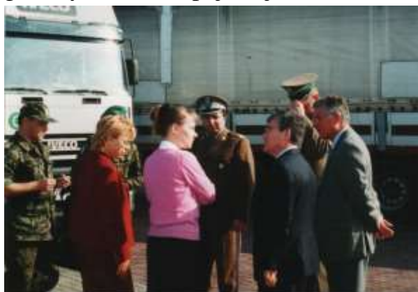
Goście z Unii na przejściu drogowym.

Chroniony odcinek przez Oddział systematycznie staje się odcinkiem granicy Unii Europejskiej.