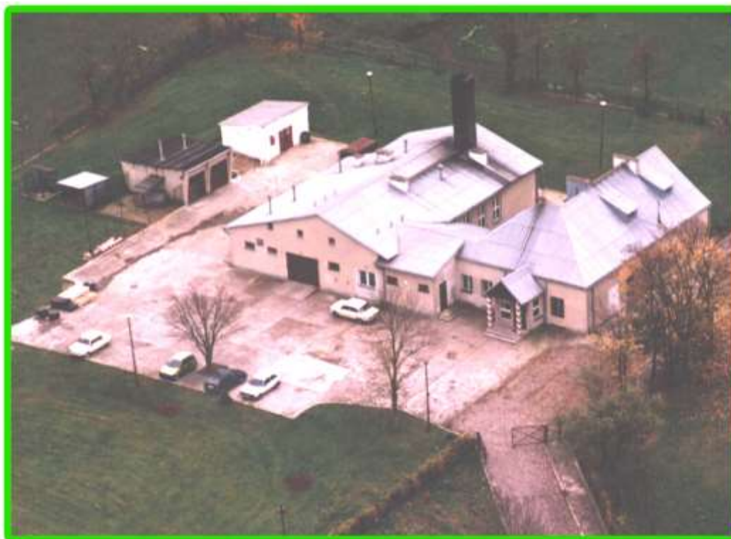
Strażnica Wizajny z lotu ptaka.

Zgodnie z zadaniami Podlaskiego Oddziału Straży Granicznej zostaje rozbudowana ilość strażnic na odcinku służbowej odpowiedzialności.