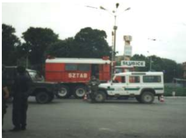
Sztab akcji przeciwpowodziowej w Słubicach.

W dniu 15 lipca 1997 roku do Krosna Odrzańskiego wyjechało 35 funkcjonariuszy na akcję przeciwpowodziową. Nasi funkcjonariusze skierowani byli do wzmocnienia wałów oraz ochrony mienia mieszkańców miasta Słubice.