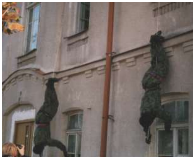
Ćwiczenie plutonu specjalnego na terenie koszar.