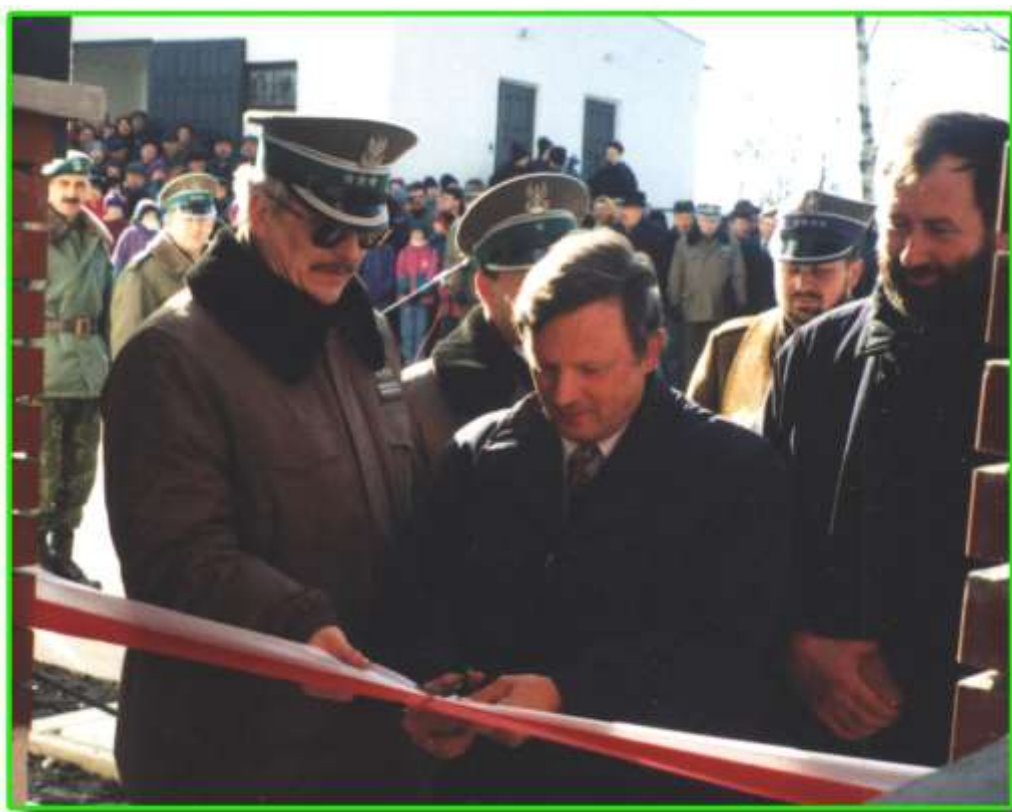
Otwarcie Strażnicy Nowy Dwór.

Pogranicznicy z Nowego Dworu będą działać na terenie trzech gmin – Nowy Dwór, Dąbrowa Białostocka i Sidra.