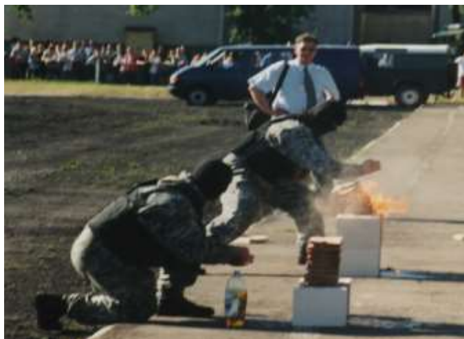
Pokaz sprawności funkcjonariuszy plutonu specjalnego.