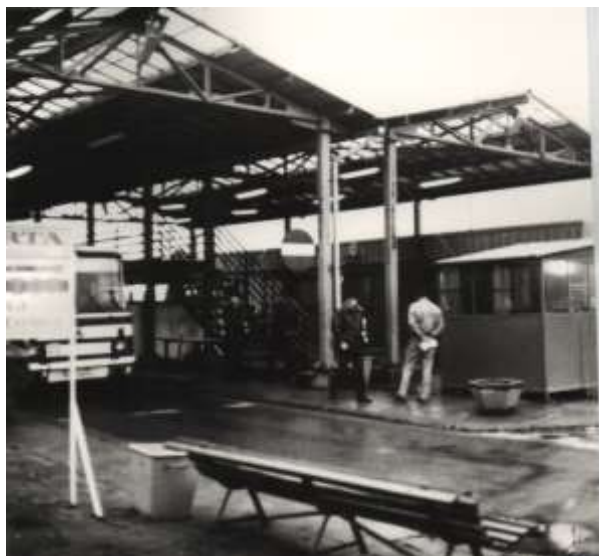
Terminal odpraw w Kuźnicy w 2000 roku.

Główny SG. Budowa przejścia ma być zakończona w 2003 roku. Nowe przejście zajmować będzie obszar 18 ha, a obecnie zajmuje 2 ha.