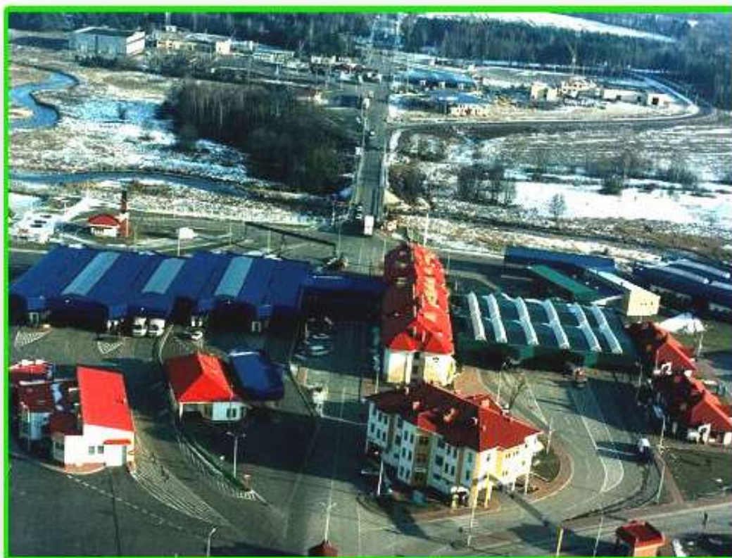
Przejście graniczne z lotu ptaka w Bobrownikach.

W dniu 26 marca 1993 roku uruchomiono przejście towarowe w m. Bobrownikach. Celem usprawnienia obsługi wprowadzono wspólną odprawę paszportową po stronie białoruskiej. Z funduszu wojewody rozpoczęto budowę pomieszczeń dla Straży Granicznej i Urzędu Celnego.