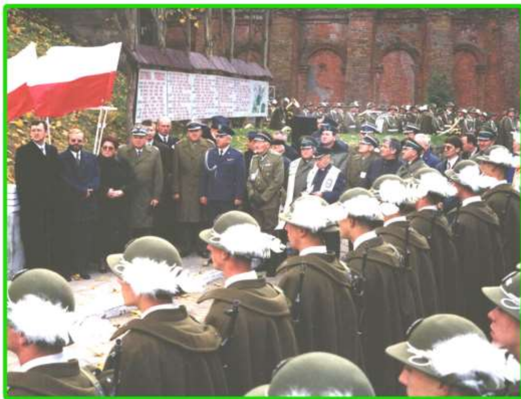
Kompania Honorowa SG i goście w Twierdzy Osowiec.