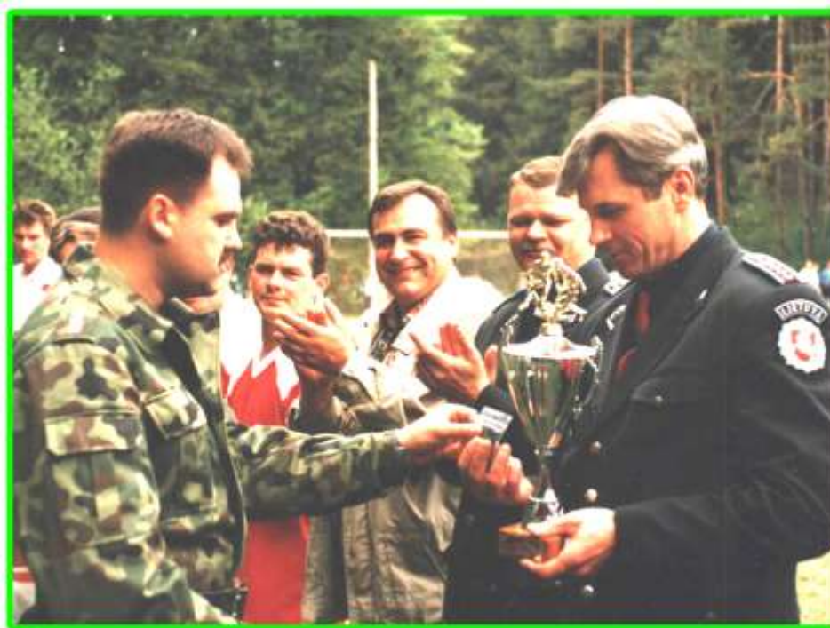
Nagrody z okazji spotkania sportowego.

W dniu 10 listopada delegacja Oddziału przebywała w Warszawie na uroczystym nadaniu sztandaru Komendzie Głównej Straży Granicznej, która odbyła się przed Grobem Nieznanego Żołnierza.