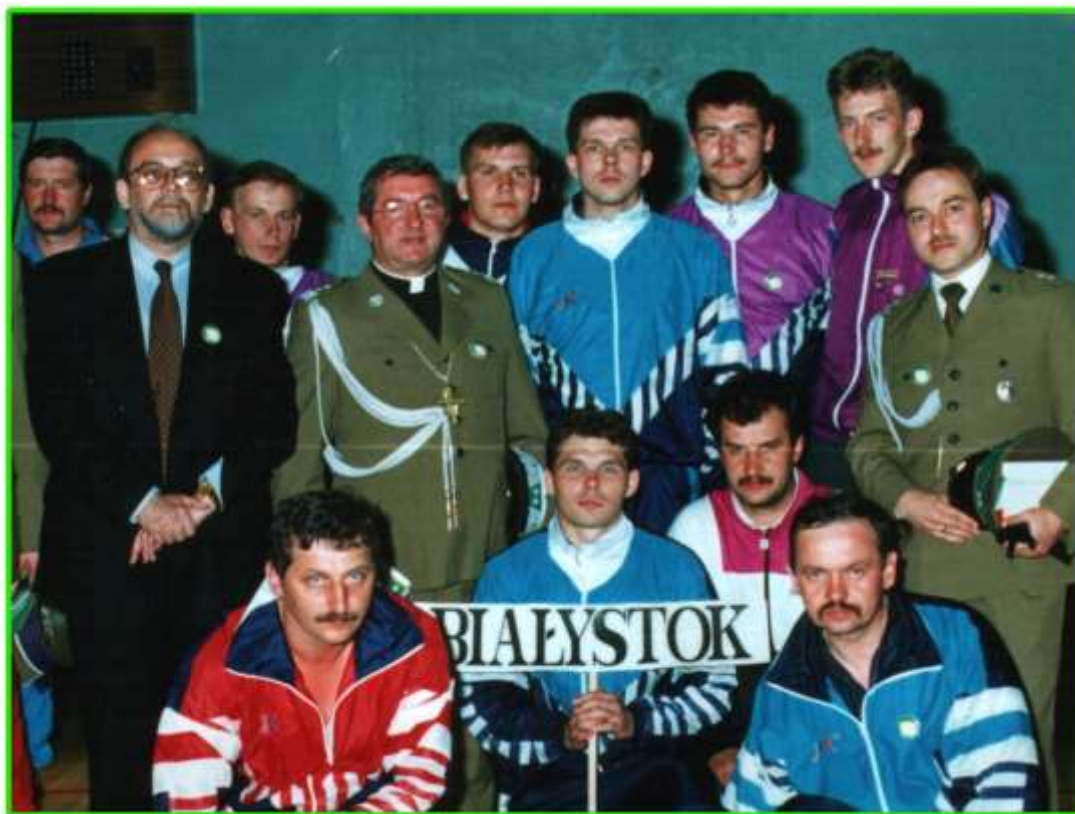
Przedstawiciele naszego Oddziału razem z Komendantem Głównym SG, Komendantem Oddziału i Biskupem Polowym gen. Leszkiem Głódziem.

W Spartakiadzie wzięło udział 12 ekip z każdego oddziału i Komendy Głównej SG.