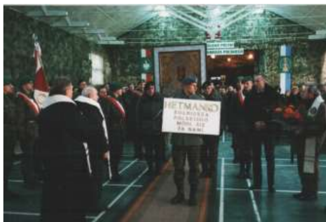
W piątek 17 grudnia 1999 roku Obraz uroczyście został pożegnany do jednostki wojskowej w Osowcu.