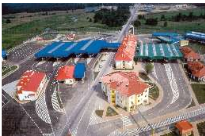
Przejście drogowe z lotu ptaka.

Współpraca pomiędzy tymi dwoma jednostkami opierać się ma między innymi na organizacji wystaw. Na terenie koszar wystawiono sprzęt wojskowy z okresu XIX i XX wieku. Najbardziej wartościowymi eksponatami są armaty z twierdzy Osowiec oraz samochód FAJ z 1929 roku.