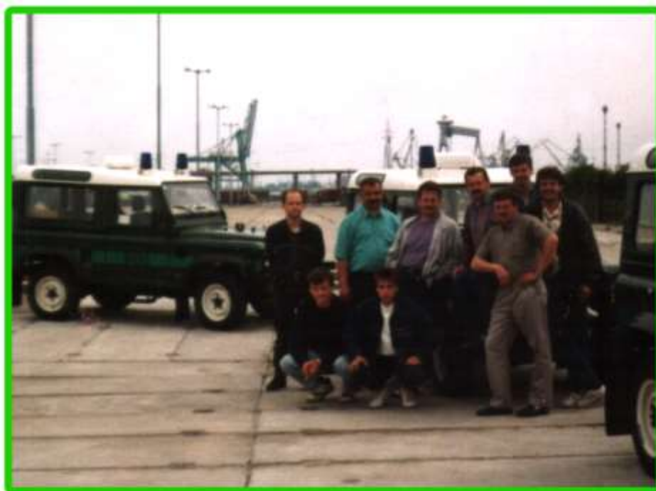
Nowa partia pojazdów odbierana w porcie w Gdyni.

W 1993 roku otrzymaliśmy do Oddziału nowe pojazdy – razem za cały rok odebraliśmy 16 Volkswagenów i 8 Land-Rowerów.