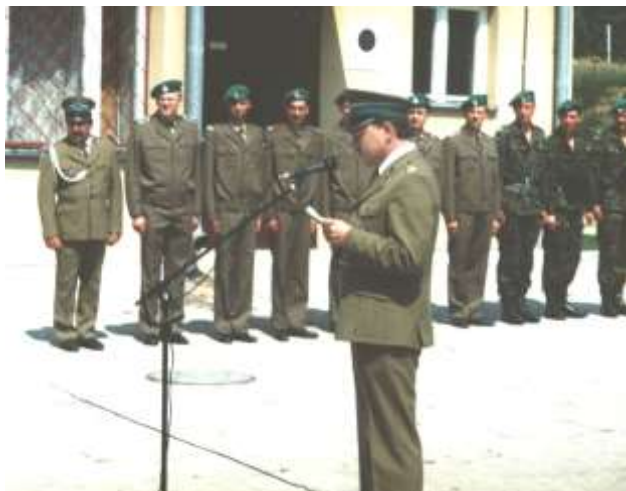
Przemawia Komendant PoOSG podczas otwarcia Strażnicy w Mielniku.

W dniu 4 lipca 1996 roku w Mielniku otwarto nową Strażnicę Straży Granicznej.