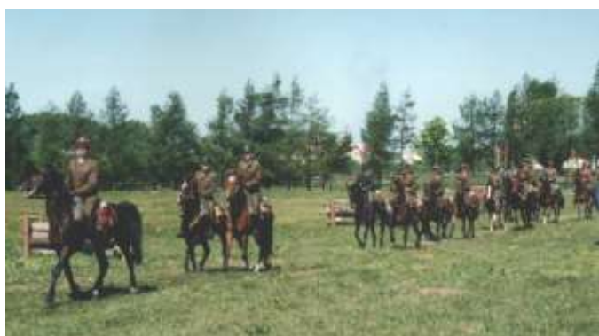
Zawody ujeżdżania koni nawiązały do zawodów hipicznych z okresu międzywojennego, które odbyły się 1936 roku w Białymstoku.