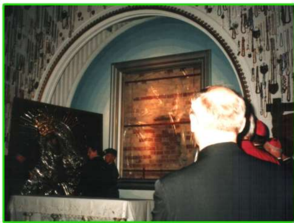
Uroczystości odbyły się w Kościele Farnym.

W dniu 7 czerwca na terenie miasta Białegostoku zorganizowana była uroczystość z okazji koronacji obrazu Matki Boskiej Miłosierdzia. Oprócz pocztu sztandarowego w uroczystości brali udział funkcjonariusze oraz kadra Oddziału.