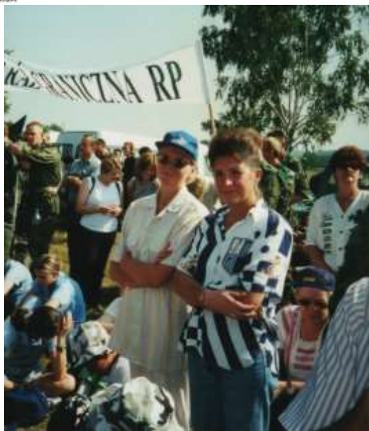
Nasze Panie na pielgrzymce do Częstochowy.

W tym samym miesiącu odbyła się pielgrzymka wiernych wyznania prawosławnego na Górę Grabarkę do Sanktuarium.