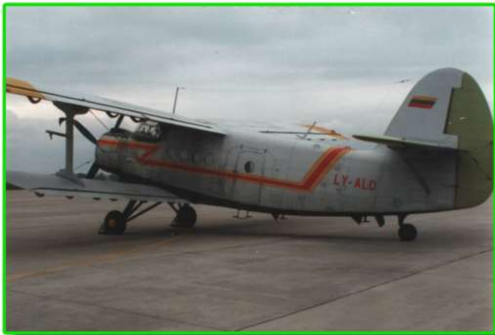
An-2 zatrzymany na lotnisku w Gdańsku.

Od połowy roku nielegalnie przestrzeń powietrzną granicy polsko-litewskiej przekroczyło, aż 40 razy samoloty z przemytem towaru i ludzi.