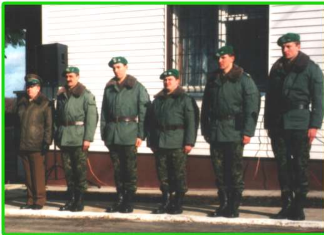
Pierwsza obsada w strażnicy w m. Nowy Dwór.

Strażnica umiejscowiona między strażnicami w m. Lipsku i Sokółce, pozwoli na skuteczniejszą kontrolę graniczną.