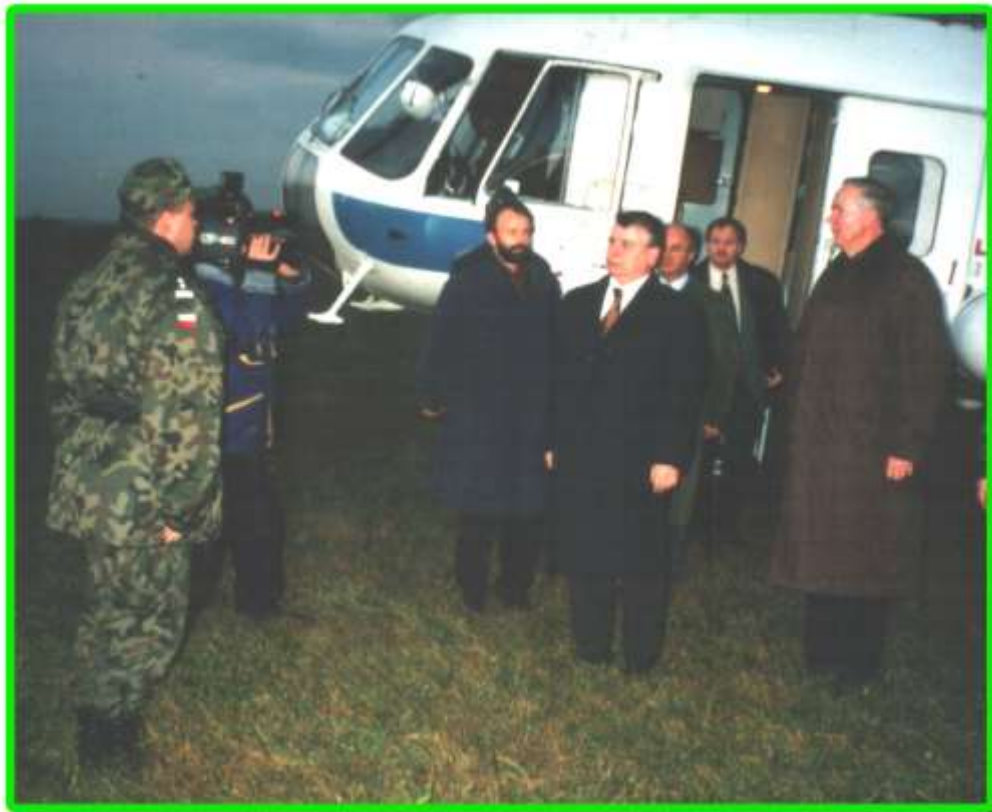
Meldunek składa dla Ministra Komendant Podlaskiego OSG.