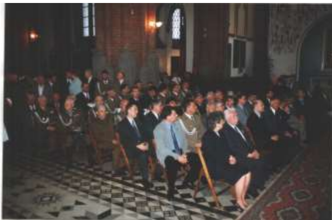
Msza Święta odbyła się w Kościele Farnym. W pierwszym rzędzie siedzi pani Marszałek Senatu i Prezydent RP na uchodźstwie Pan Ryszard Kaczorowski.

Na dziedzińcu Pałacu Braniewskich odbyły się oficjalne uroczystości – apel i wyróżnienie 130 funkcjonariuszy Straży Granicznej. W uroczystościach wzięli udział przedstawiciele najwyższych władz państwowych, reprezentacje wszystkich Oddziałów Granicznych, weterani KOP, goście z Białorusi, Litwy. Gospodarzem był Komendant Główny SG, a organizatorem nasz Oddział.