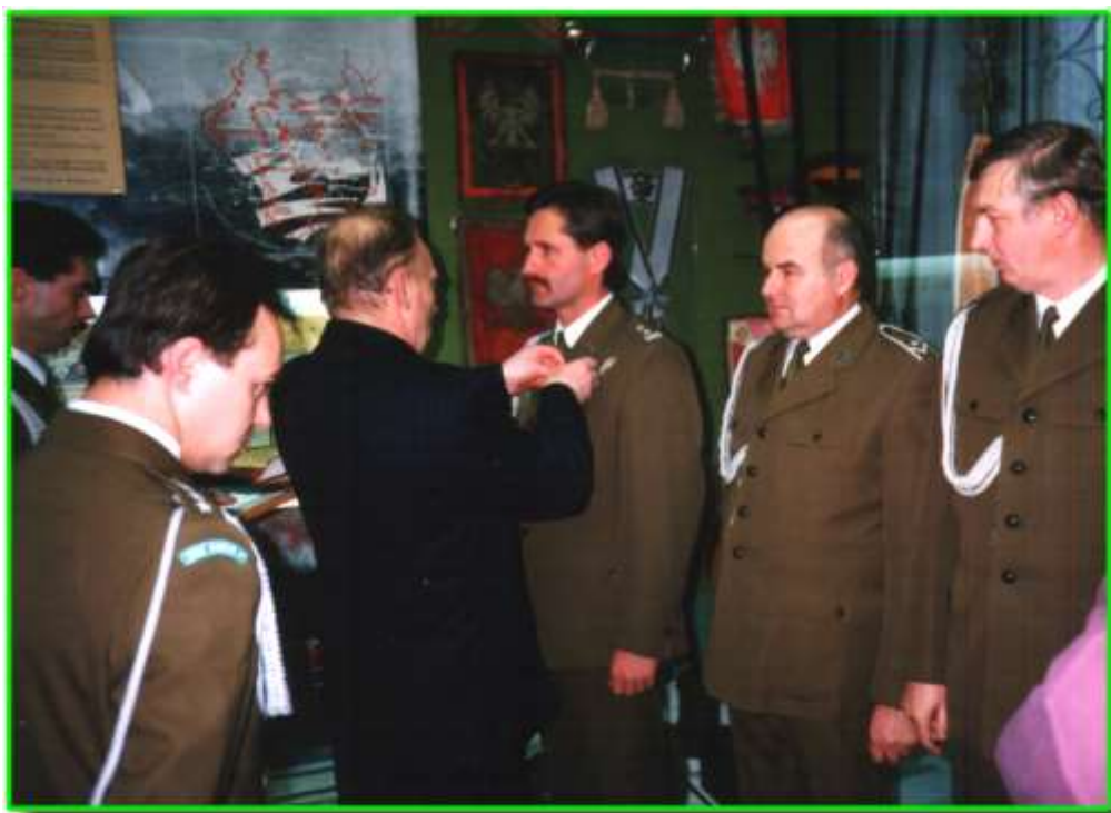
Minister MSW odznacza funkcjonariusz Podlaskiego Oddziału SG.

Rok 1994 okazał się rokiem rekordowym pod względem prób nielegalnego przekroczenia polskiej granicy na odcinku naszego Oddziału. Nasi funkcjonariusze zatrzymali 30 większych grup imigrantów ze wschodu, w sumie 600 obywateli państw azjatyckich. Kwitł w tym roku również przemyt samochodów. Udaremniliśmy wywóz 520 pojazdów z czego 300 na przejściu granicznym w Kuźnicy Białostockiej.