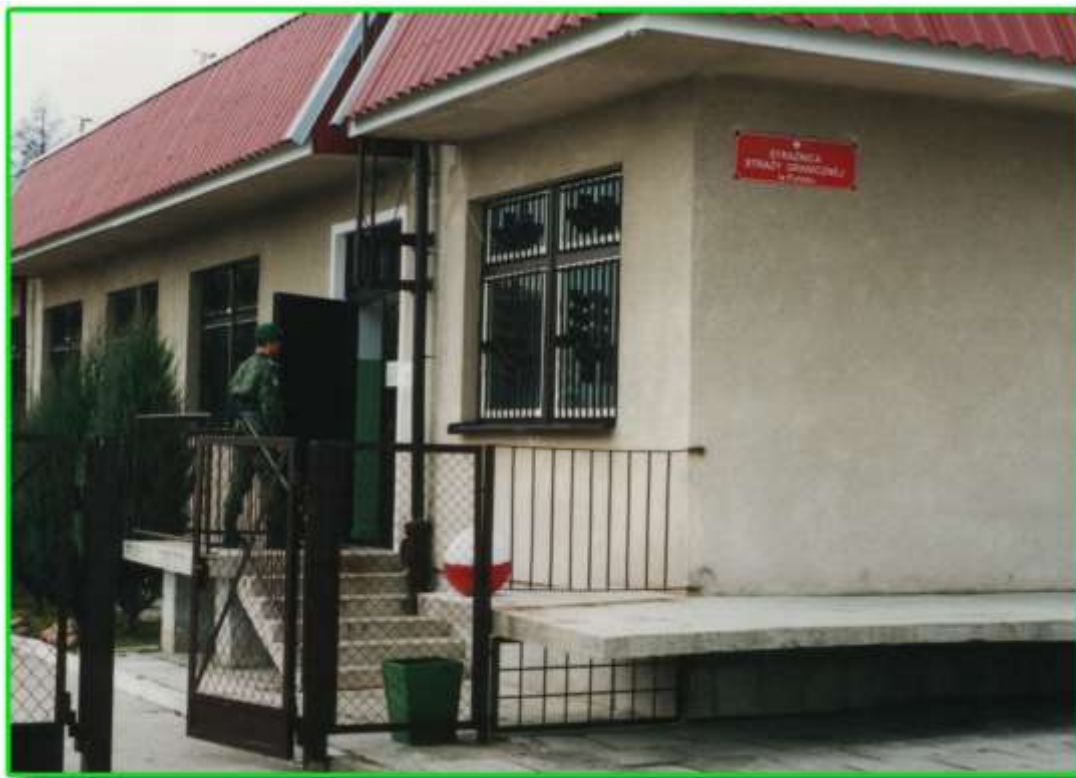
Placówka Straży Granicznej w Puńsku.

Konflikt o nową strażnicę na odcinku litewskim narasta. Litwini nie zamierzają oddać ośrodka zdrowia bez „walki”. Doprowadzili do oflagowania budynku. Dla rozwiązania konfliktu zaangażowali się posłowie, senatorowie oraz władze centralne naszego państwa.