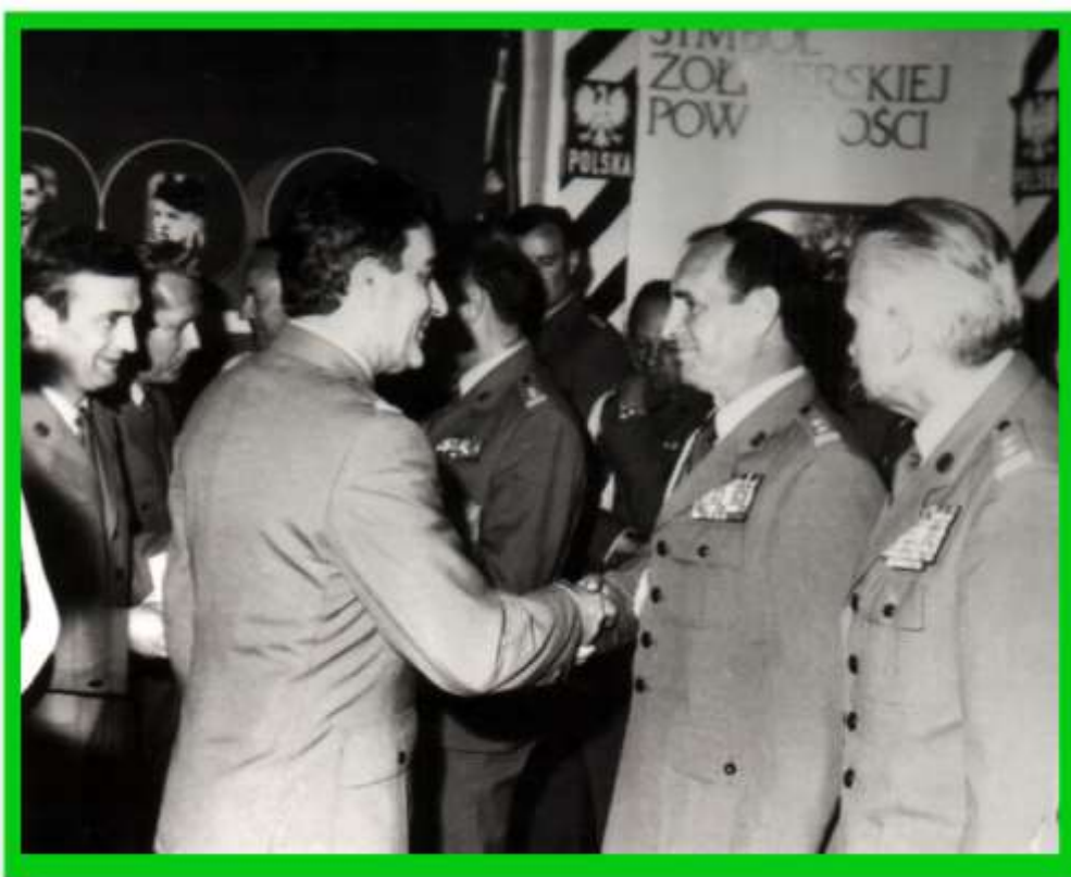
Pierwszy Komendant PoOSG żegna grupę 50 żołnierzy zawodowych WOP odchodzących do rezerwy w maju 1991 roku.

Termin uroczystości ustalono na pierwszą rocznicę powstania Straży Granicznej. W oparciu o opracowany plan przedsięwzięć organizacyjnych rozpoczęły się intensywne prace nad przygotowaniem do uroczystości.