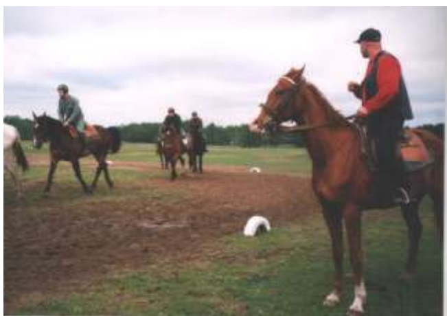
Nasi kawalerzyści przeszli najpierw szkolenie pod okiem fachowca w ośrodku jeździeckim.

Ponadto otrzymaliśmy pięć koni, które trafiły do strażnic w Wiżajnach, Rutka Tartak i Białowieża.