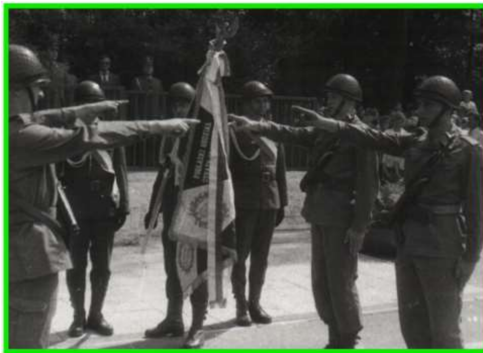
Już nie przysięga, a ślubowanie pierwszych funkcjonariuszy Straży Granicznej w Białymstoku.

Dzień 16 maja ustanowił uroczyście obchodzonym co roku ŚWIĘTEM STRAŻY GRANICZNEJ.