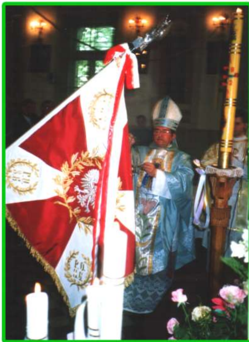
Sztandar poświęcił Jego Eminencja ks. gen Sławoj Leszek Głódź.

Prace rozpoczęte w zeszłym roku przez Społeczny Komitet Fundacji Sztandaru i nadania imienia patrona dobiegały końca. W dniu 23 maja 1992 roku o godz. 11.00 odbyła się Msza Święta w Kościele pw. Św. Stanisława w intencji poświęcenia nowego sztandaru.