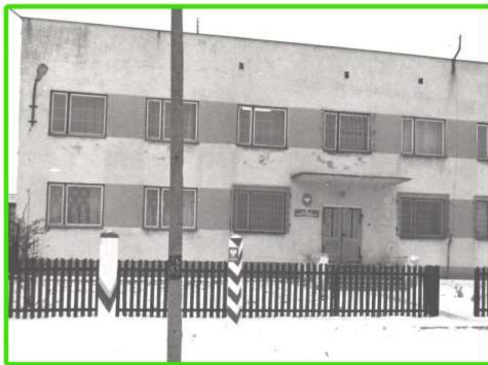
Strażnica w Szypliszkach.

W dniu 5 sierpnia 1993 roku zakończono remont budynku w m. Szypliszki, w którym będzie utworzona strażnica Straży Granicznej. Budynek i działka o powierzchni 0,5 ha wykupiona została od Spółdzielni Rolniczej za sumę 2 mld. 232 mln. zł. Otwarcie strażnicy nastąpiło w październiku 1993 roku.