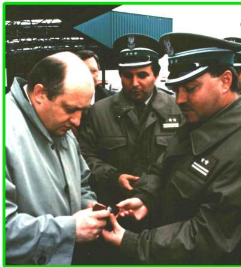
Komendant PoOSG wręcza replikę sygnetu KOP dla Ministra MSW i A.

Jednak ruch osobowy naprawdę ruszy dopiero po zbudowaniu po stronie białoruskiej podobnej infrastruktury.