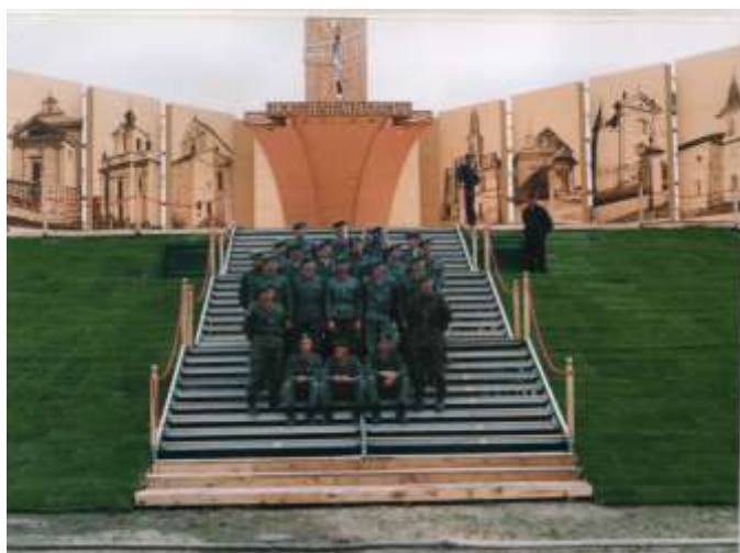
Funkcjonariusz PoOSG w Drohiczynie.

W celu usprawnienia ruchu granicznego w przejściach granicznych wydzielono specjalne pasy dla grup pielgrzymujących. Paszport wymagany jest tylko od kierownika grupy. Lista uczestników ma zawierać podstawowe dane osobowe uczestników pielgrzymki.