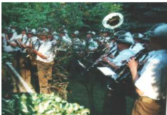
Orkiestra była wszędzie i naprawdę była najwspanialsza.