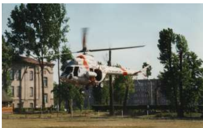
Piloci to naprawdę wysokiej klasy specjaliści.