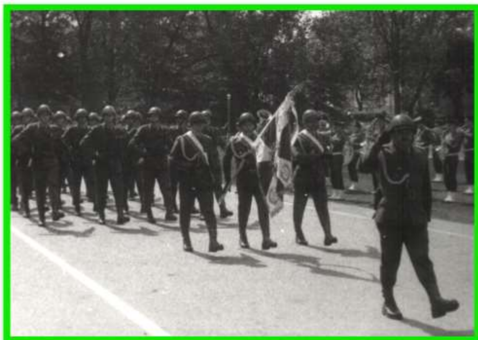
I defilada – z nowym sztandarem.

W dniu 25 maja odbyło się pierwsze uroczyste ślubowanie funkcjonariuszy w służbie kandydackiej.