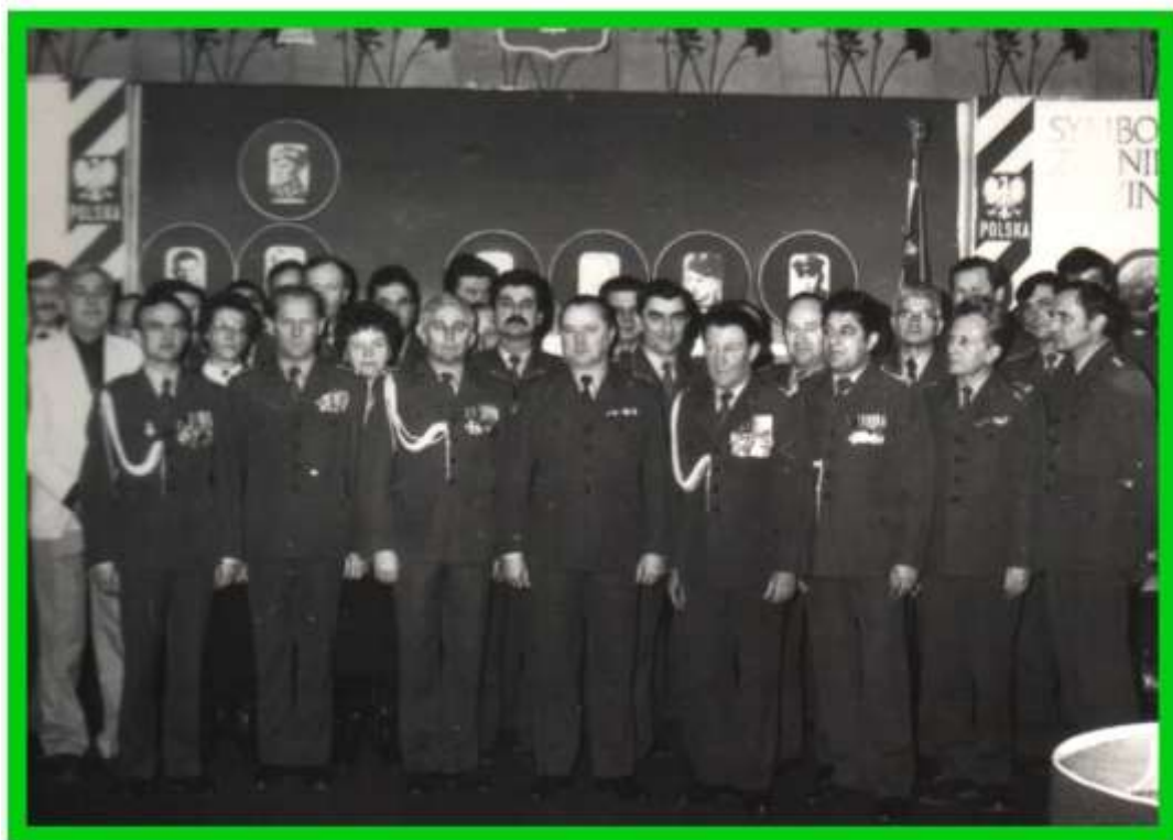
Wspólne zdjęcie w Sali Tradycji w środku Dowódca PMB WOP i Komendant PoOSG.