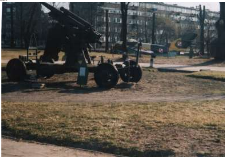
Armata przeciwlotnicza kalibru 75 mm, w oddali samolot Lim-5.

Współpraca pomiędzy tymi dwoma jednostkami opierać się ma między innymi na organizacji wystaw. Na terenie koszar wystawiono sprzęt wojskowy z okresu XIX i XX wieku. Najbardziej wartościowymi eksponatami są armaty z twierdzy Osowiec oraz samochód FAJ z 1929 roku.