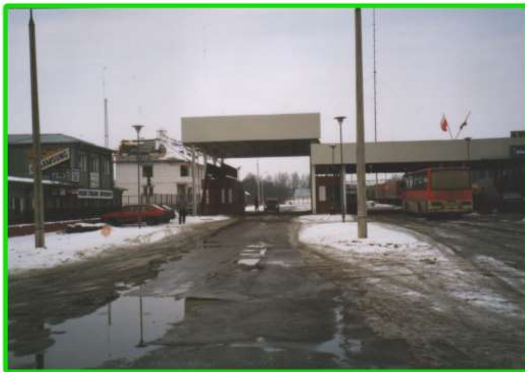
Przeście drogowe w m. Ogrodniki.