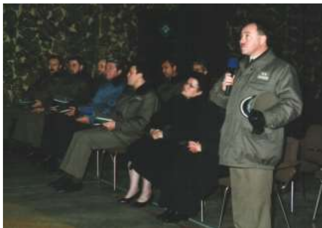
Obraz przywitał Komendant PoOSG.

W dniach 9-17 grudnia 1999 roku na Oddziale gościł Obraz NMP Królowej Polski, Hetmanki Żołnierza Polskiego.