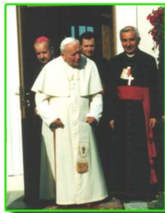
Ojciec Święty w Wigrach.

W dniach 5-17 czerwca 1999 roku w Polsce przebywał Ojciec Święty Jan Paweł II.