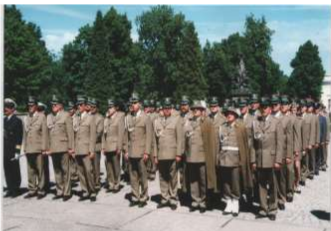
Kadra na zbiórce na placu Pałacu Braniewskich.