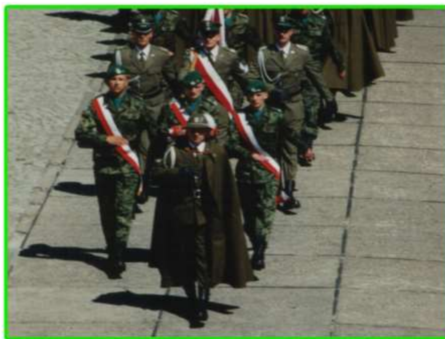
Główne uroczystości odbyły się na placu Pałacu Branickich.