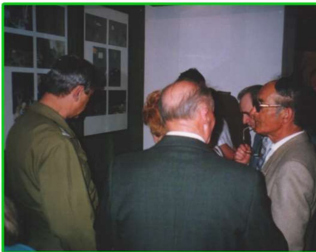
Najwięcej zainteresowania budziły pamiątki katyńskie.