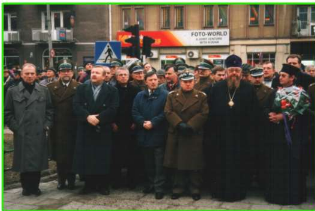
Uczestnicy obchodów przed Pomnikiem Marszałka Józefa Piłsudskiego.

Minister Milczanowski podczas swojego wystąpienia wspominał o tym, że znów granica wschodnia jest niebezpieczna, a główne zagrożenie to nielegalna migracja, powstanie wokół niej przestępczości zorganizowanej i różnego typu patologii gospodarczych.