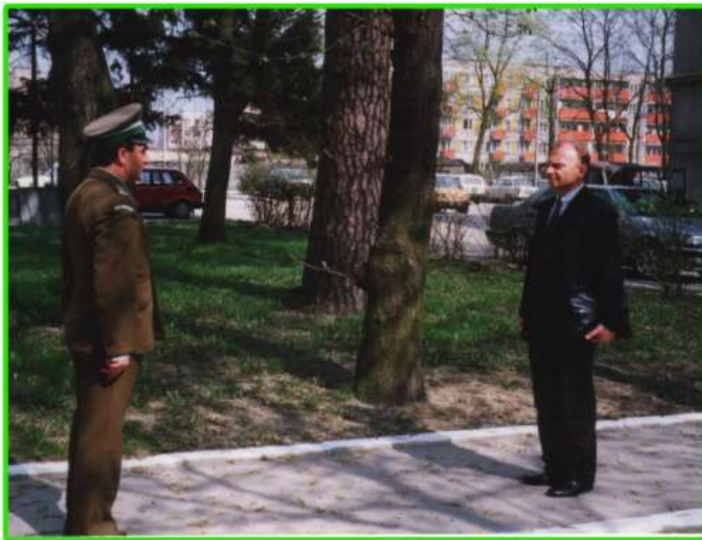
Meldunek składa dla Ministra MSW Komendant PoOSG.

Zgodnie z zadaniami Podlaskiego Oddziału Straży Granicznej zostaje rozbudowana ilość strażnic na odcinku służbowej odpowiedzialności.