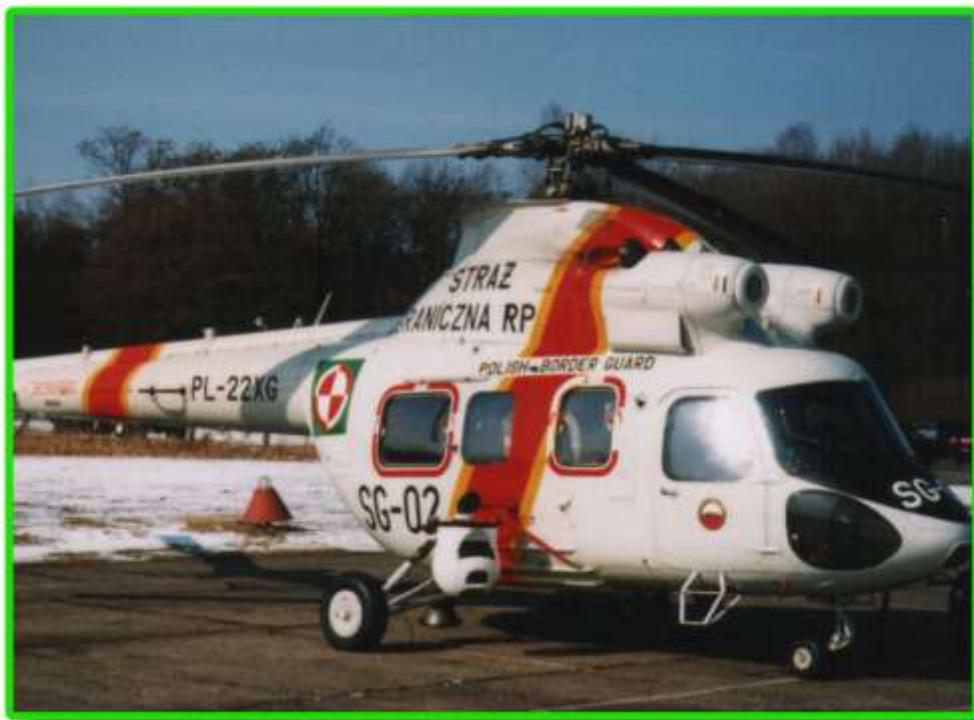
Śmigłowiec typu „Kania”.

W 1999 roku na terenie odpowiedzialności służbowej Podlaskiego Oddziału Straży Granicznej przemyt ludzi przez granicę zmniejszył się ponad trzykrotnie. Poprzez uszczelnienie granicy Polski i Litwy. To zasługa zarówno naszych jak i litewskich służb. W tym roku zatrzymaliśmy 96 osób, które przekroczyły lub usiłowały przekroczyć granicę z tego 37 azjatów w grupach zorganizowanych. Poprawę skuteczności działania prewencyjnego w strefie nadgranicznej osiągnęliśmy dzięki wykorzystaniu śmigłowca typu „Kania” i samolotu typu „Wilga”.