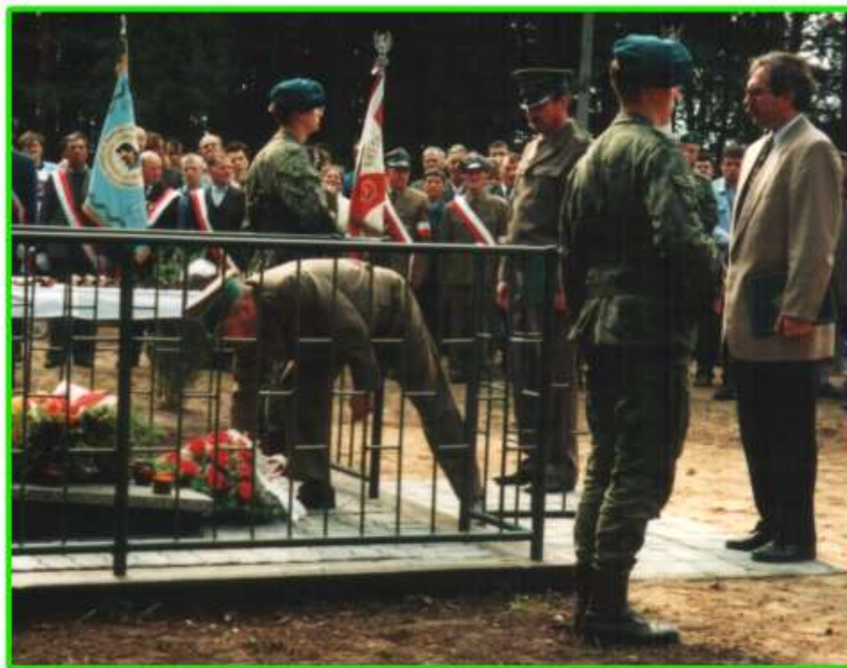
Uroczystości we wsi Pruszanek k. Brańska.

W składzie tej brygady walczyli żołnierze 9 pułku strzelców konnych i 14 dywizjonu artylerii konnej w kampanii wrześniowej 1939 roku. Żołnierze artylerii konnej stacjonowali w naszych koszarach w okresie międzywojennym. Wspólnie z mieszkańcami wioski postawiono krzyże i ogrodzono miejsce pochówku.