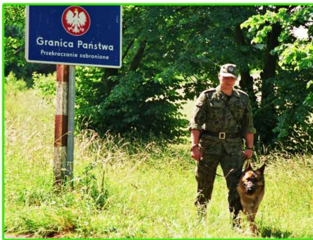
Patrol z psem służbowym na granicy.

Z dniem wejścia ustawy Minister Spraw Wewnętrznych wyznaczył termin 6 miesięcy na zorganizowanie nowej formacji. W dniu 10 grudnia 1990 roku Komendant Główny Straży Granicznej płk. prof. Marek Lisiecki wydał Zarządzenie Nr 1/90 w sprawie organizacji Komendy Głównej SG. Zakończenie roku następuje w istniejącej jeszcze Podlasko-Mazurskiej Brygadzie Wojsk Ochrony Pogranicza pracami przygotowawczymi zmierzającymi do powołania nowej jednostki w północno-wschodnim regionie Polski.