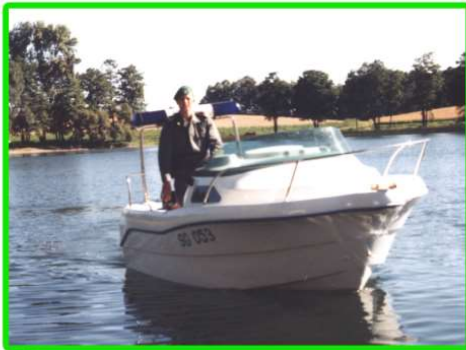
Nasz jacht motorowy na jeziorze Gaładuś.

W czasie służby patrolowej dowódca łodzi zetknął się już kilkakrotnie z próbami bezszelestnego przepłynięcia się przez jezioro na pontonach, materacach czy na oponach samochodowych. Wprowadzenie na jezioro szybkiej i nowoczesnej łodzi ma zapobiec podobnym przypadkom.