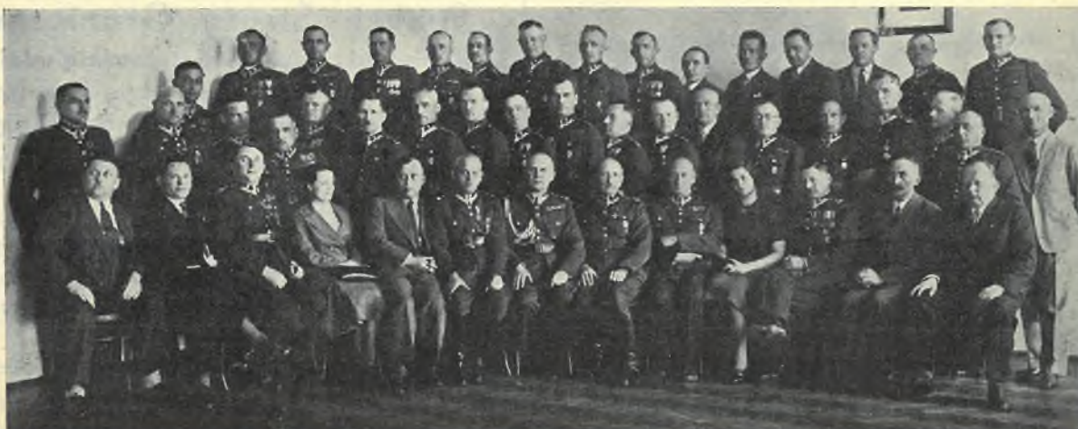
Uczestnicy Walnego Zgromadzenia K. W. P. w dniu 12 maja 1935 r.